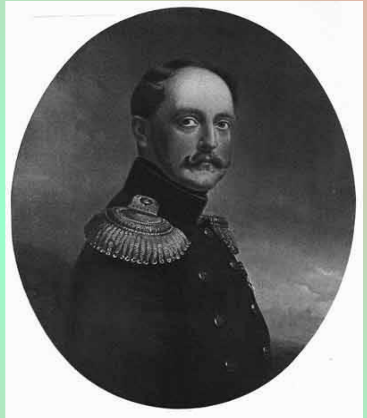
Царь Николай Первый

Пушкин остается верен идеалам декабристов, о чем свидетельствуют его стихи «Арион» (1827), «Во глубине сибирских руд» (1827), «Анчар» (1828).