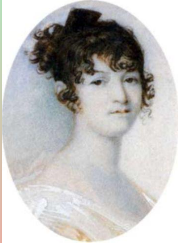
Надежда Осиповна – мать Пушкина