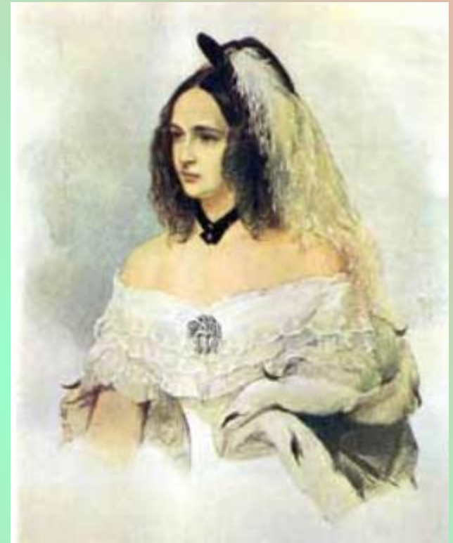
Наталья Николаевна Гончарова