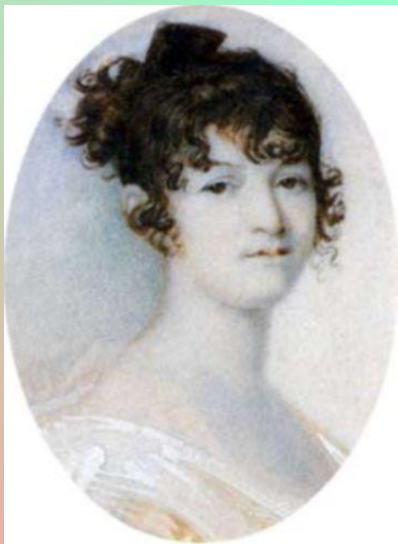
Надежда Осиповна – мать Пушкина