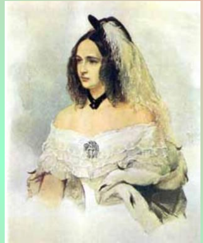
Наталья Николаевна Гончарова