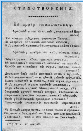
Первое печатное стихотворение "К другу стихотворцу"