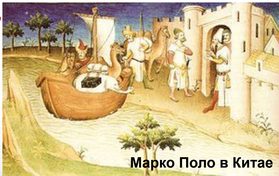
Марко Поло в Китае

В 1271 г. венецианский купец Марко Поло отправился в далекий и загадочный Китай. Путь в Китай лежал через многие страны. Вернувшись домой почти через четверть века, он не переставал восторгаться увиденными чудесами. В его речи то и дело слышалось: «Миллионе... миллионе». Слово «mille» («тысяча») было известно еще в Древнем Риме. Словечко «миллионе» , которым отважный путешественник называл тысячу тысяч , прочно пристало к Марко Поло. Современники прозвали его Марко Миллионе.