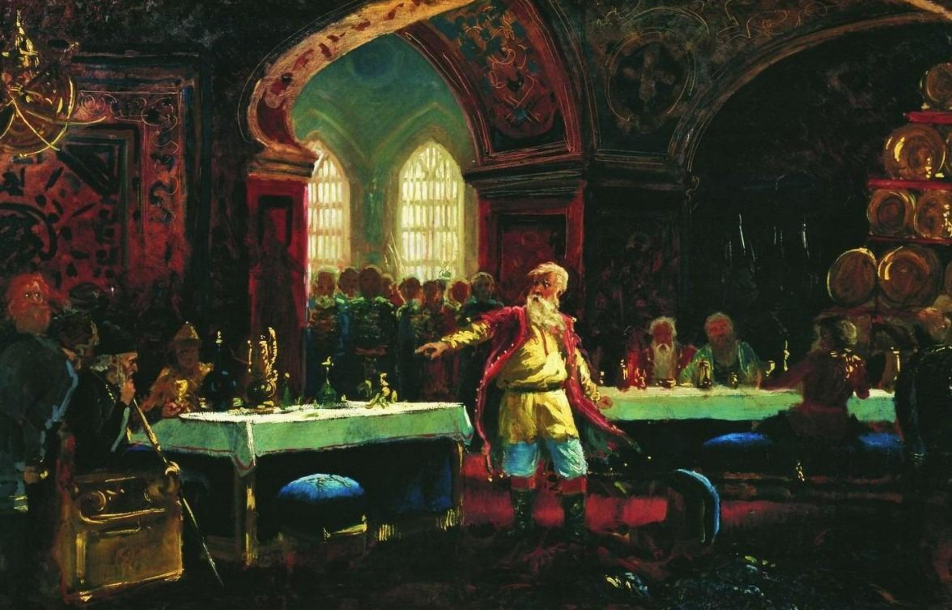
К.Е. Маковский «Князь Репнин на пиру у Ивана Грозного» 1880 г.