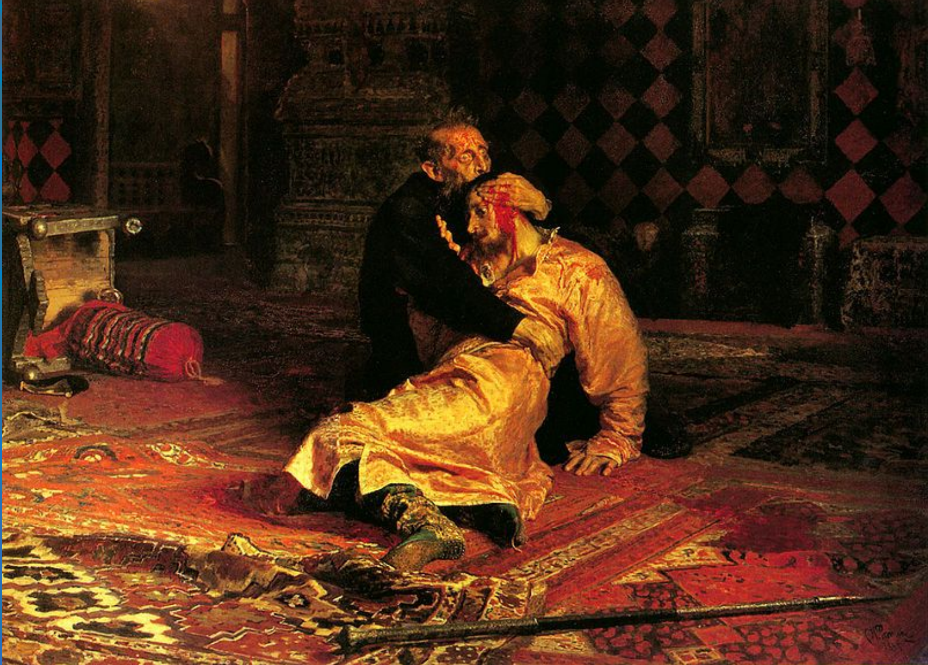
И.Е. Репин. «Иван Грозный и сын его Иван 16 ноября 1581 года».