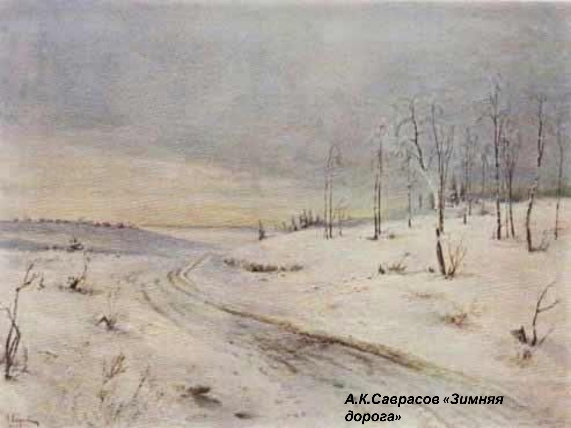
А.К.Саврасов «Зимняя дорога»