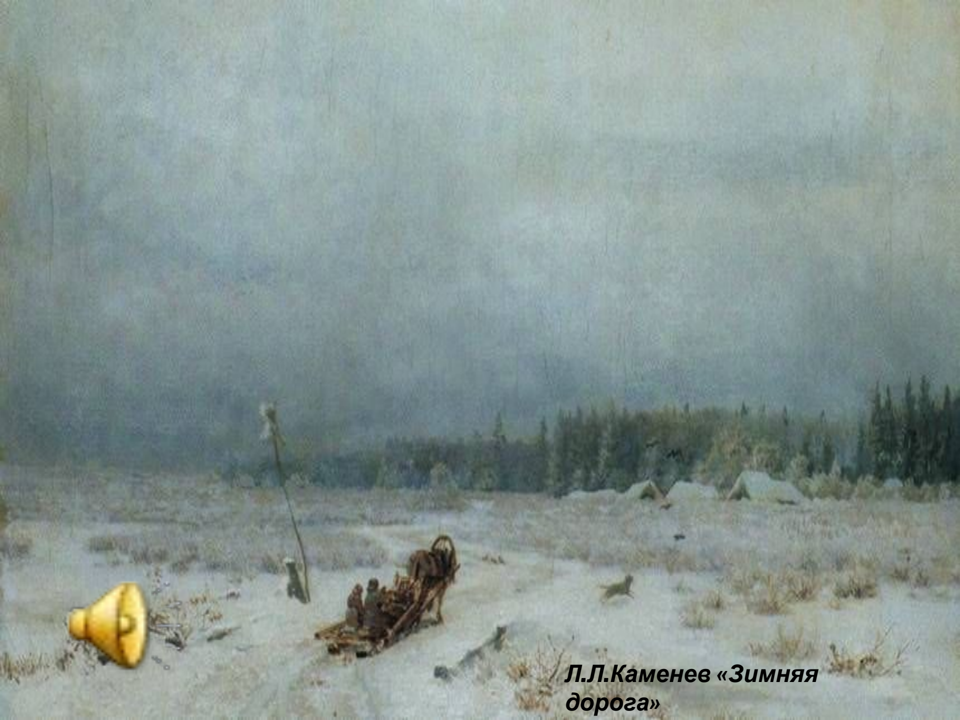
Л.Л.Каменев «Зимняя дорога»