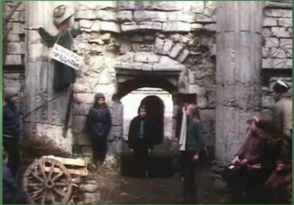
Штильке, Герман Антон Жанна д'Арк на костре