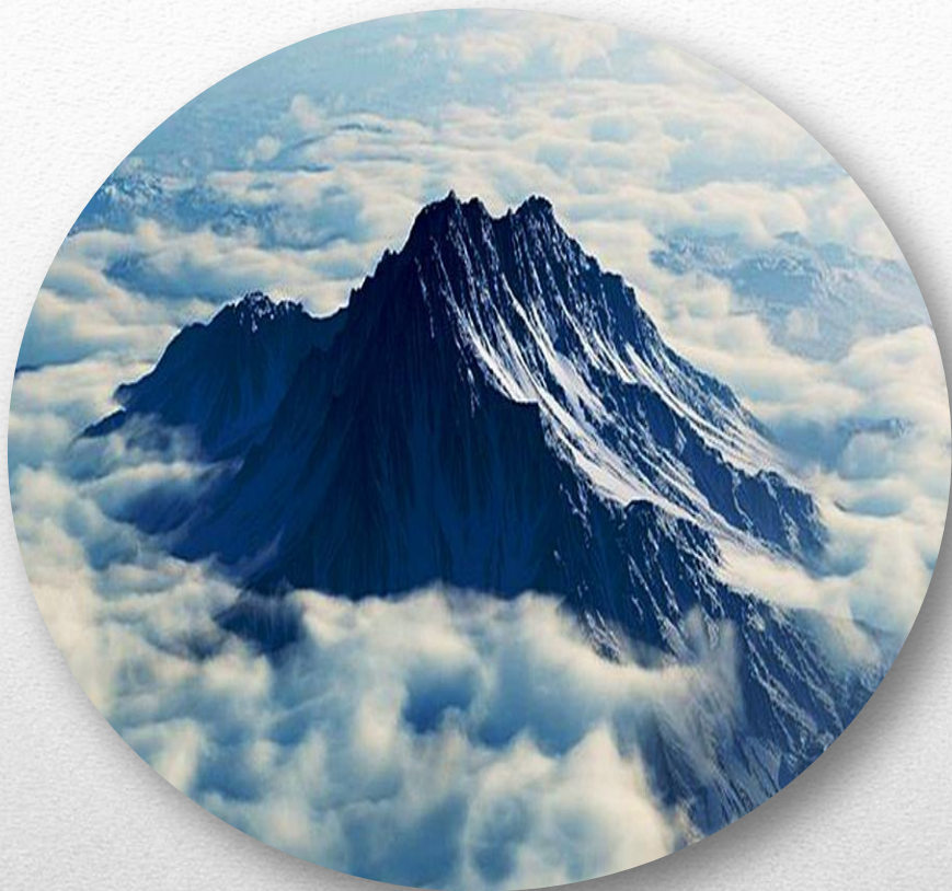
Гора Олимп на фотоснимке