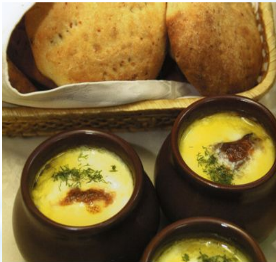
Саламат. Якутские лепешки.