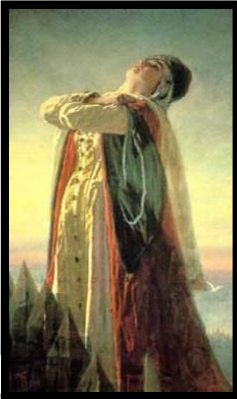
Василий Перов « Плач Ярославны » 1881 год