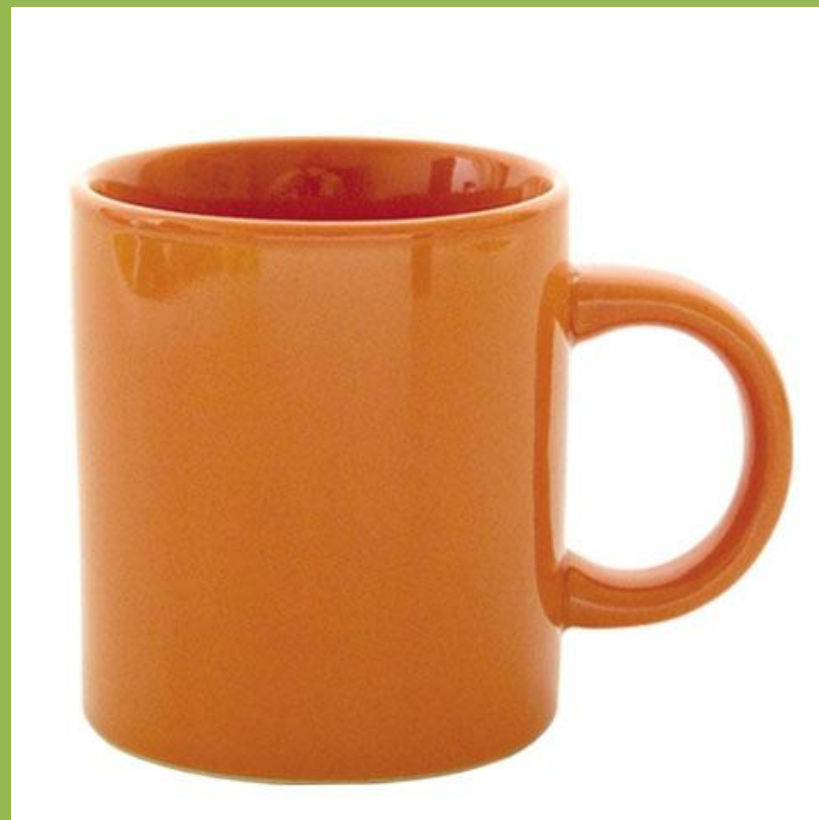
очень большая кружка