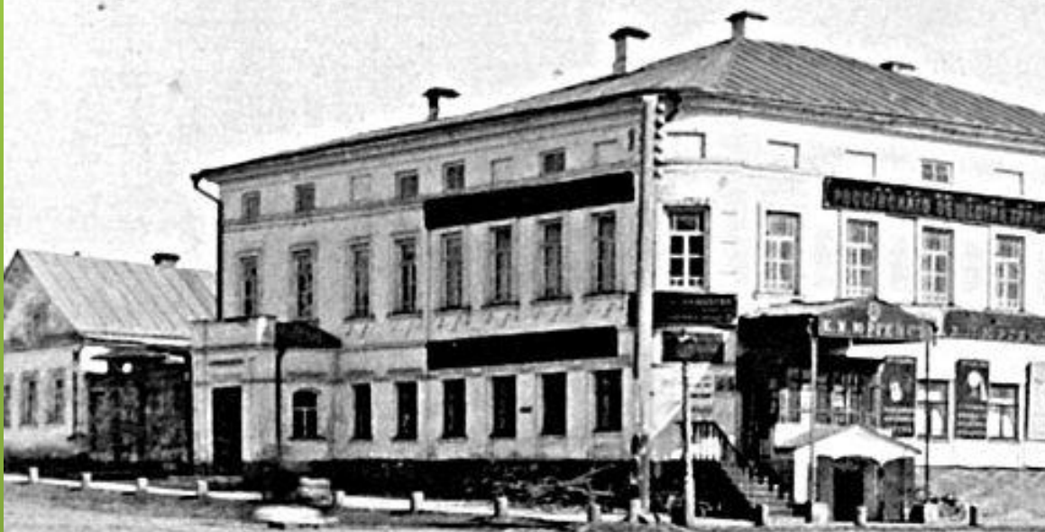
Дом в Симбирске, где родился И.А. Гончаров

Когда Гончарову было всего семь лет, умер его отец.