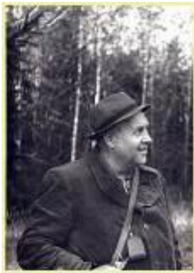
Георгий Алексеевич Скребицкий