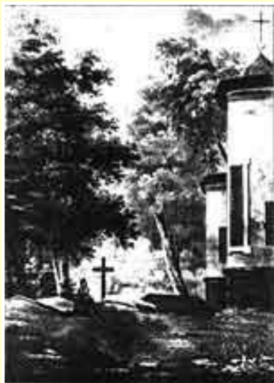
Могила А. С. Пушкина после смерти поэта