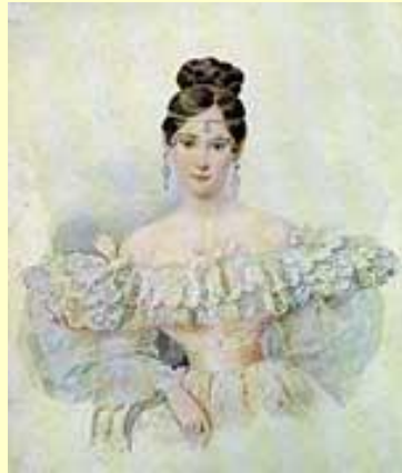
Натали Гончарова - жена А. С. Пушкина. и мать его 4 детей.