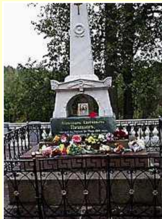
Могила А. С. Пушкина в наше время