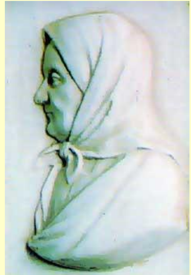
Няня Арина Родионовна