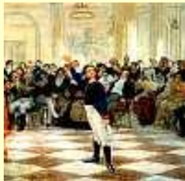
А. С. Пушкин - лицеист