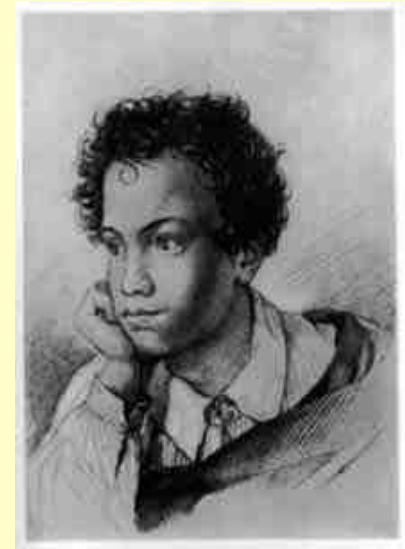
А. С. Пушкин - ученик

Но из всех предметов Саша так и не полюбил арифметику.