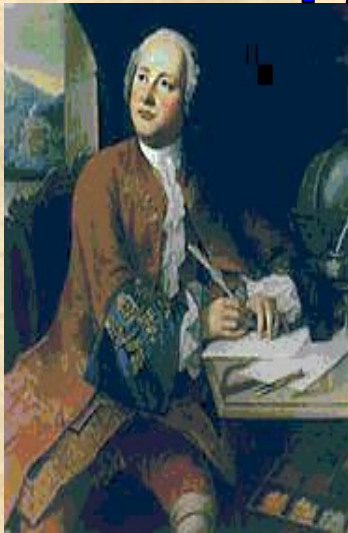
М. В. Ломоносов