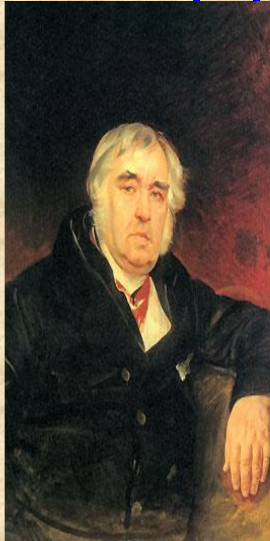
И. А. Крылов