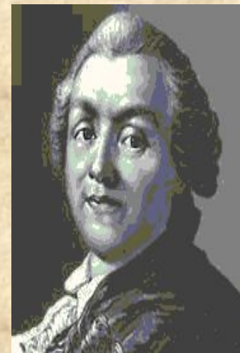
А. П. Сумароков