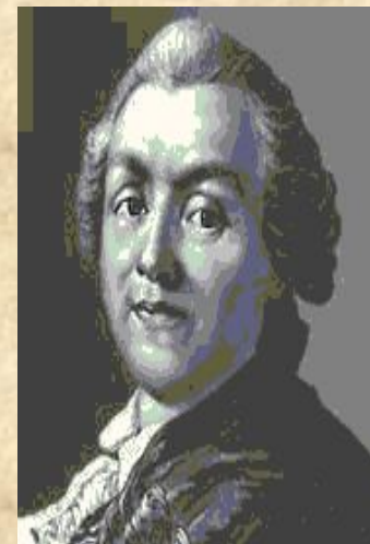
А. П. Сумароков