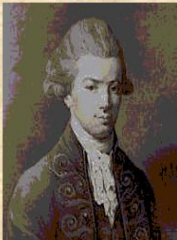
И. И. Хемницер