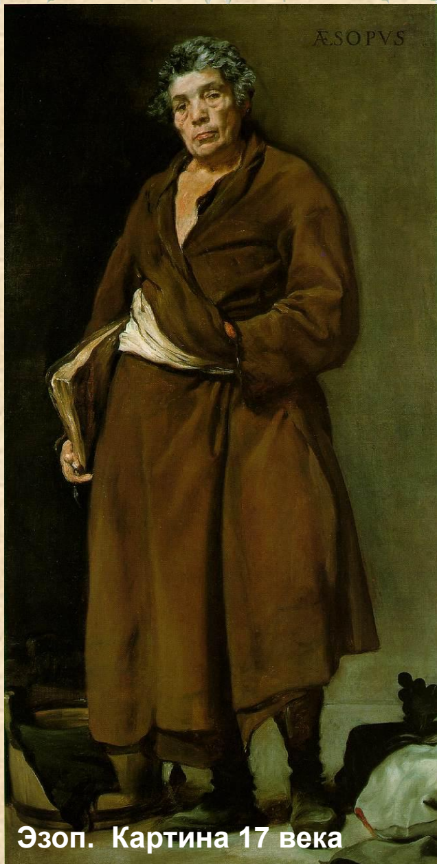
Эзоп. Картина 17 века

Эзоп - древнегреческий баснописец, раб, жил в 6 веке до н.э., был очень остроумным и популярным человеком своего времени, считается родоначальником жанра басни