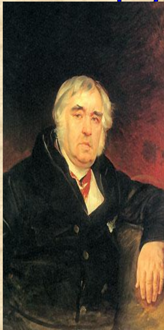
И. А. Крылов