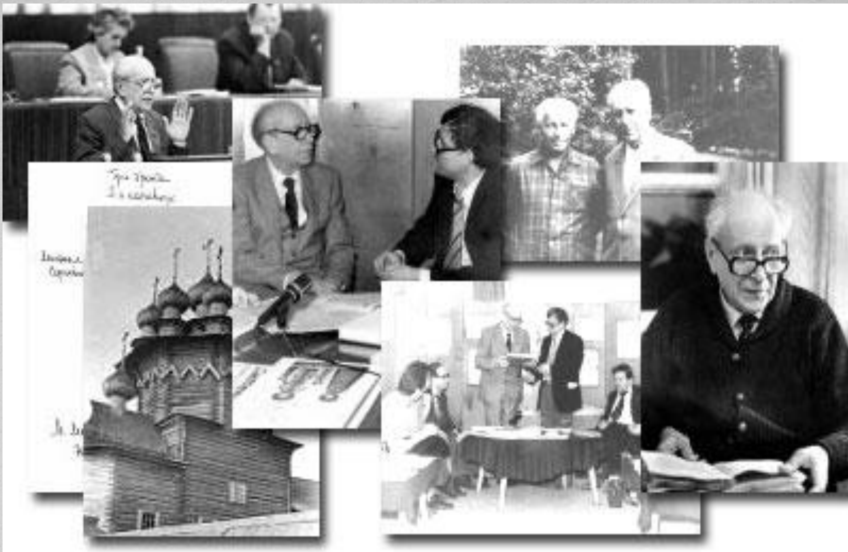
Общественная деятельность Д.С.Лихачева