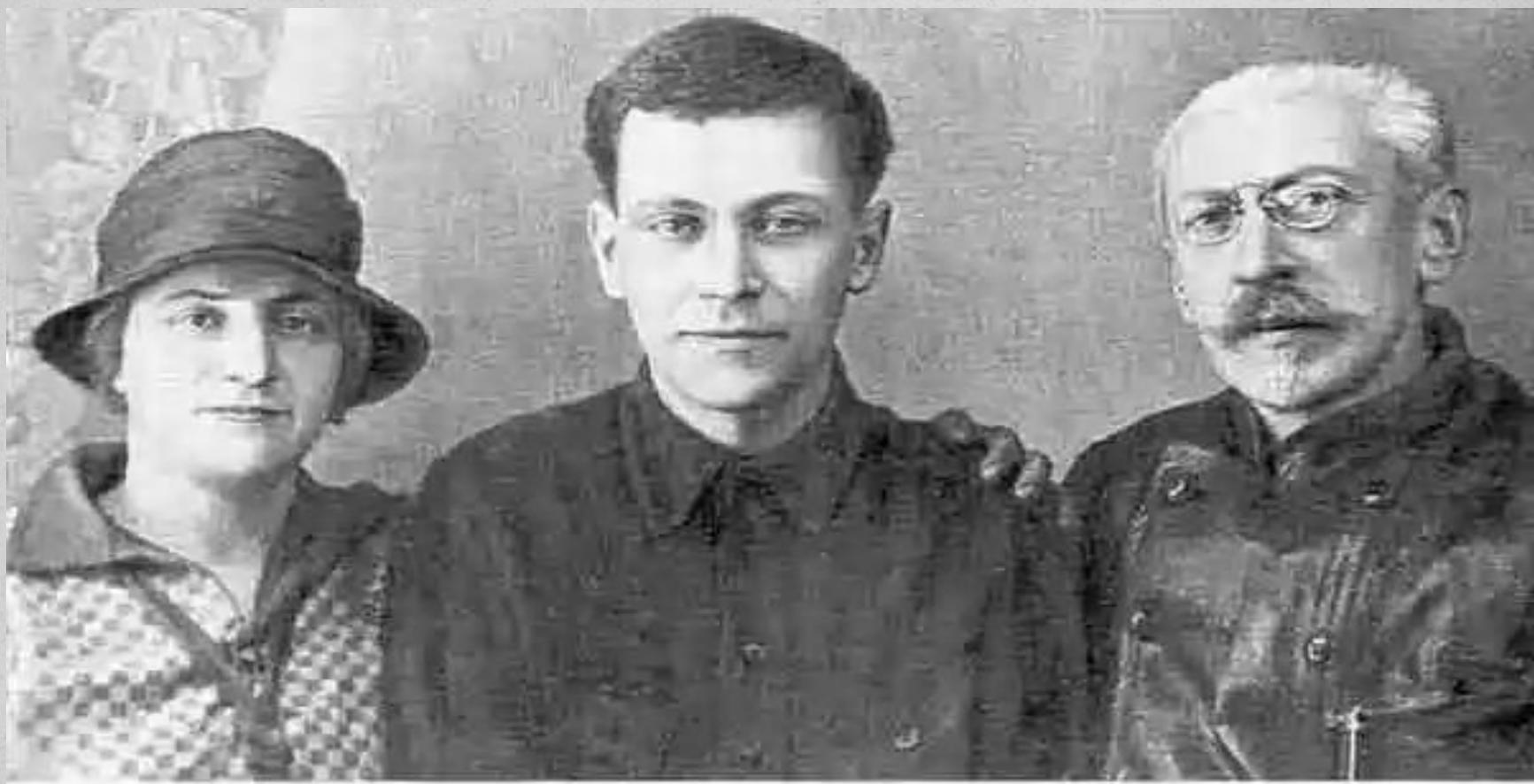
Д.С.Лихачев с родителями. 1929 г.