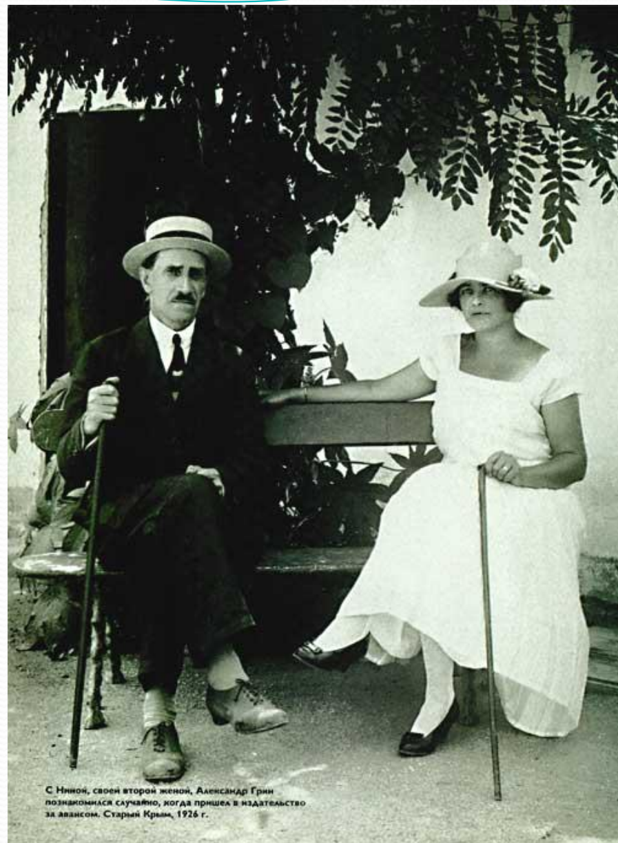
С Ниной, своей второй женой, Александр Грин познакомился случайно, когда пришел в издательство за авансом. Старый Крым, 1926 г.

Когда Грин умирал, Нина Николаевна нашла в себе силы облегчить его уход в мир иной: «Склоняясь близко к его лицу, я тихо и нежно говорила ему о нашем прошедшем счастье, о благодарности за то, что он дал мне его. Мне страстно хотелось, чтобы догорающее его сознание уходило со словами ласки и нежности, а не стенаниями ...»