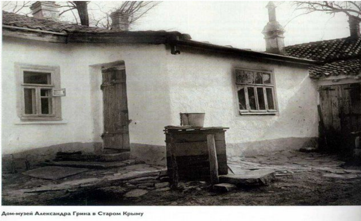
Дом-музей Александра Грина в Старом Крыму