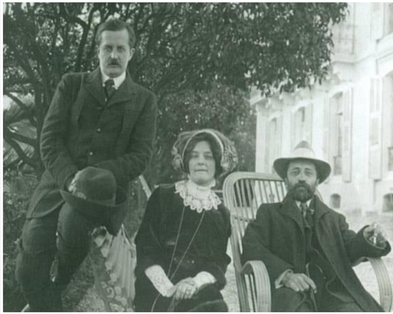
Д. Мережковский и З. Гиппиус

Не разлучайся, пока ты жив, Ни ради горя, ни для игры, Любовь не стерпит, не отомстив, Любовь отнимет свои дары