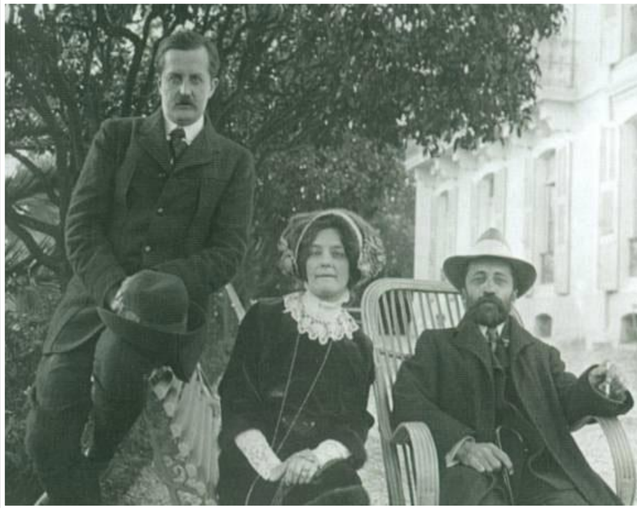
Д. Мережковский и З. Гиппиус

Не разлучайся, пока ты жив, Ни ради горя, ни для игры, Любовь не стерпит, не отомстив, Любовь отнимет свои дары