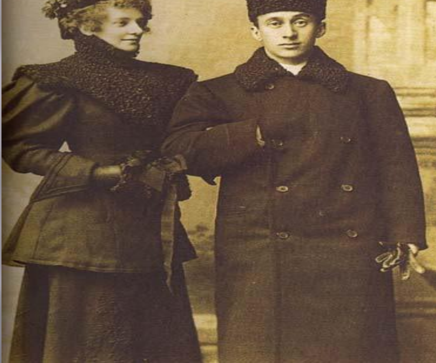
Зинаида Гиппиус и Дмитрий Мережковский: Две звезды поэзии Серебряного века