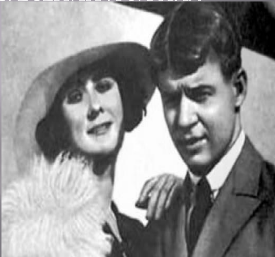
С. ЕСЕНИН И З. РАЙХ