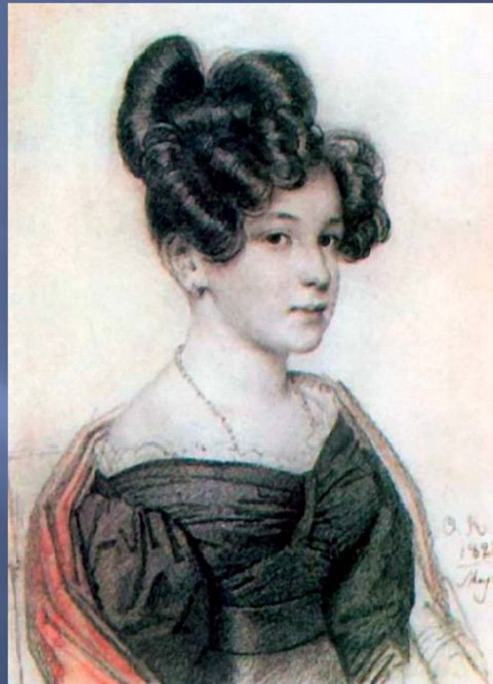
Анна Алексеевна Оленина

Я вас любил: любовь еще, быть может, В душе моей угасла не совсем; Но пусть она вас больше не тревожит; Я не хочу печалить вас ничем. Я вас любил безмолвно, безнадежно, То робостью, то ревностью томим; Я вас любил так искренно, так нежно, Как дай вам бог любимой быть другим.