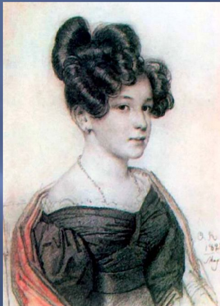
Анна Алексеевна Оленина

Я вас любил: любовь еще, быть может, В душе моей угасла не совсем; Но пусть она вас больше не тревожит; Я не хочу печалить вас ничем. Я вас любил безмолвно, безнадежно, То робостью, то ревностью томим; Я вас любил так искренно, так нежно, Как дай вам бог любимой быть другим.