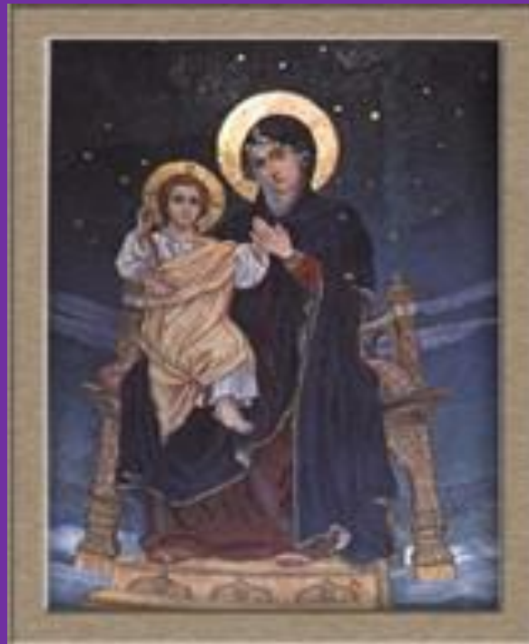
Мозаика - Богоматерь на престоле с Сыном на коленях (1899 - 1901, ГРМ)

Богородица Васнецова встала в один ряд с мадоннами лучших живописцев мира