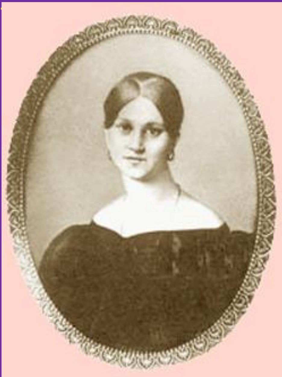
Анна Петровна Керн

И сердце бьется в упоенье, И для него воскресли вновь И божество, и вдохновенье, И жизнь, и слезы, и любовь.