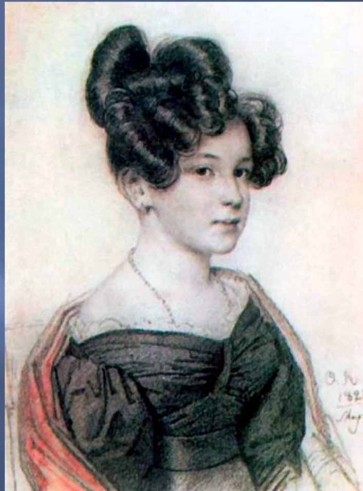
Анна Алексеевна Оленина

Я вас любил: любовь еще, быть может, В душе моей угасла не совсем; Но пусть она вас больше не тревожит; Я не хочу печалить вас ничем. Я вас любил безмолвно, безнадежно, То робостью, то ревностью томим; Я вас любил так искренно, так нежно, Как дай вам бог любимой быть другим.