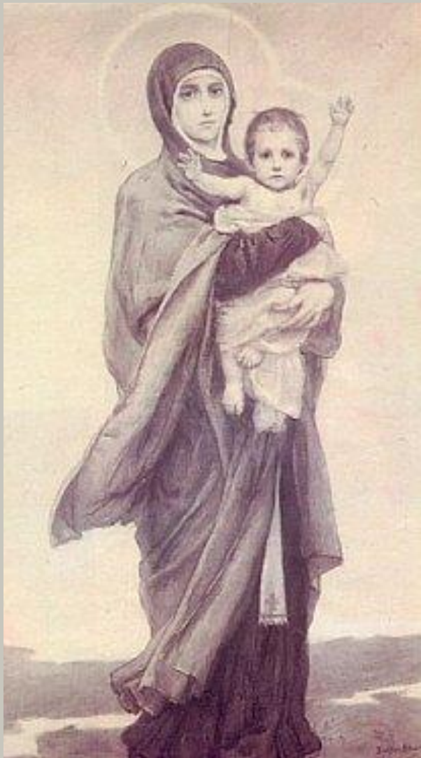
Богоматерь с младенцем Владимирского собора. Эскиз. 1893-1895