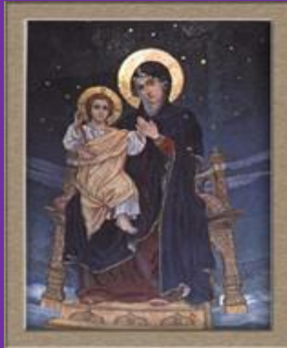
Мозаика - Богоматерь на престоле с Сыном на коленях (1899 - 1901, ГРМ)

Богородица Васнецова встала в один ряд с мадоннами лучших живописцев мира