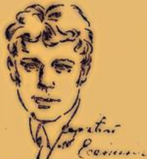
Сергей Есенин - стихи

В терем темный, в лес зеленый, На шелковы купыри, Уведу тебя под склоны Вплоть до маковой зари.