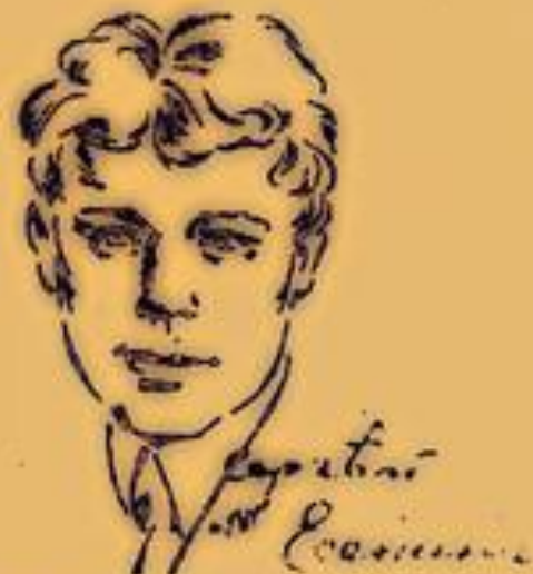
Сергей Есенин - стихи

В терем темный, в лес зеленый, На шелковы купыри, Уведу тебя под склоны Вплоть до маковой зари.