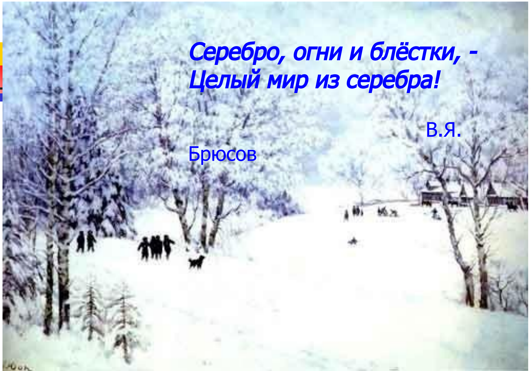
К.Юон. Русская зима