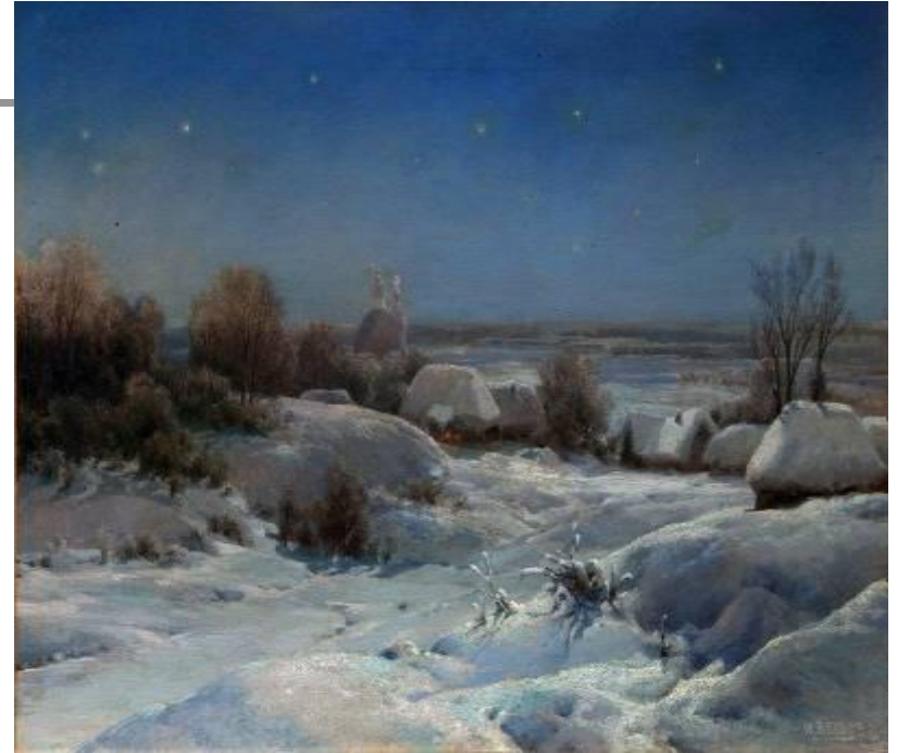
Вельц И.А. Украинская ночь. Зима.