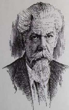
Сергей Иванович Ожегов (1900—1964)