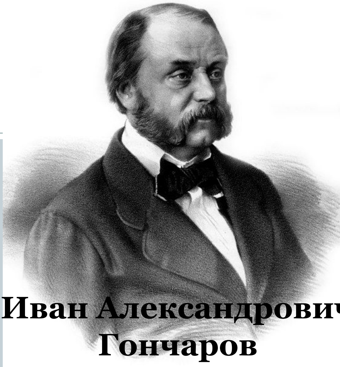
Иван Александрович Гончаров (1812-1891)