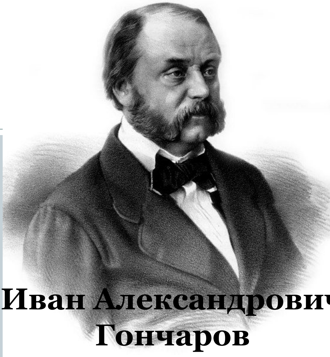
Иван Александрович Гончаров (1812-1891)