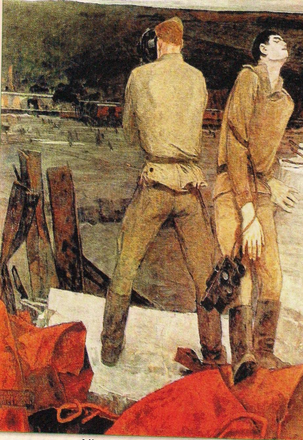
А.Никич. Военные корреспонденты. 1985

Редактор «Красной звезды» Д.Ортенберг вспоминал: «Скромная и внешне неприметная фигура Платонова, наверно, не соответствовала читательскому представлению об облике писателя. Солдаты при нём не чувствовали себя стеснёнными и свободно говорили на свои солдатские темы».