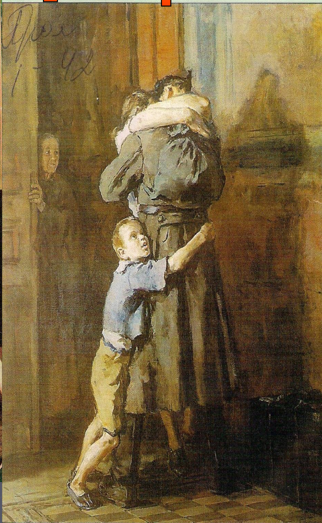
В.Н.Костецкий. Возвращение домой. 1945—1947