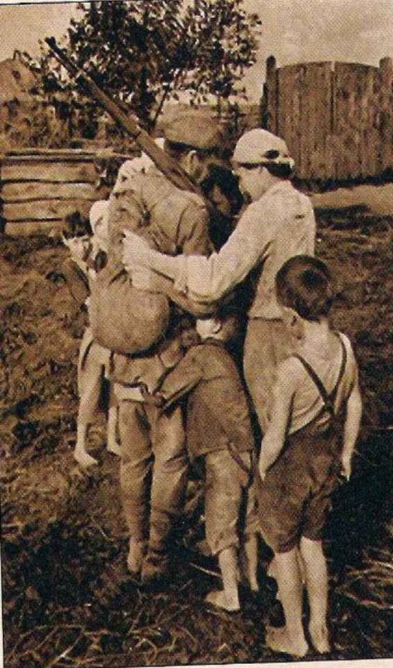
22 июня 1941 года. Начало войны..