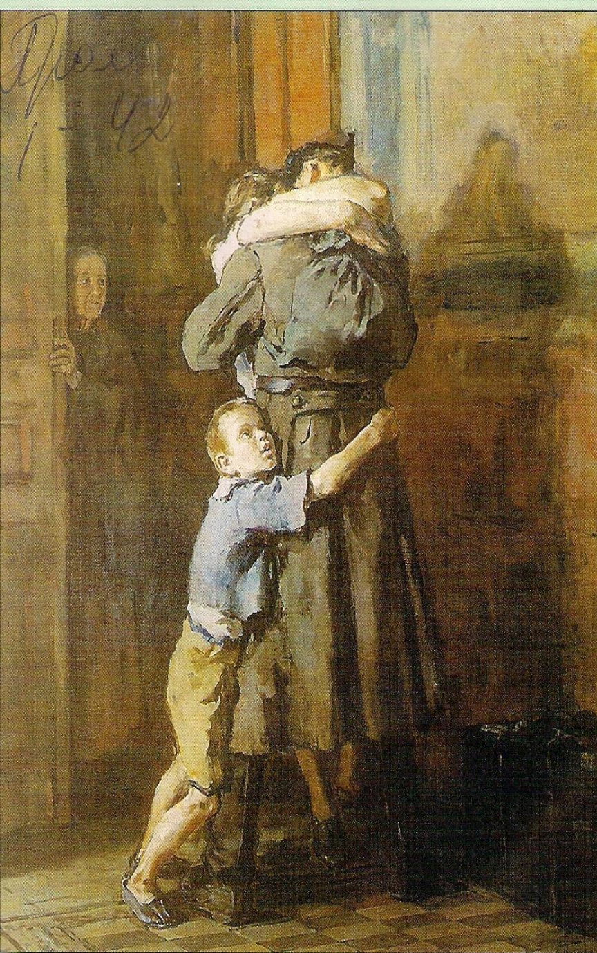
В.Н.Костецкий. Возвращение домой. 1945—1947