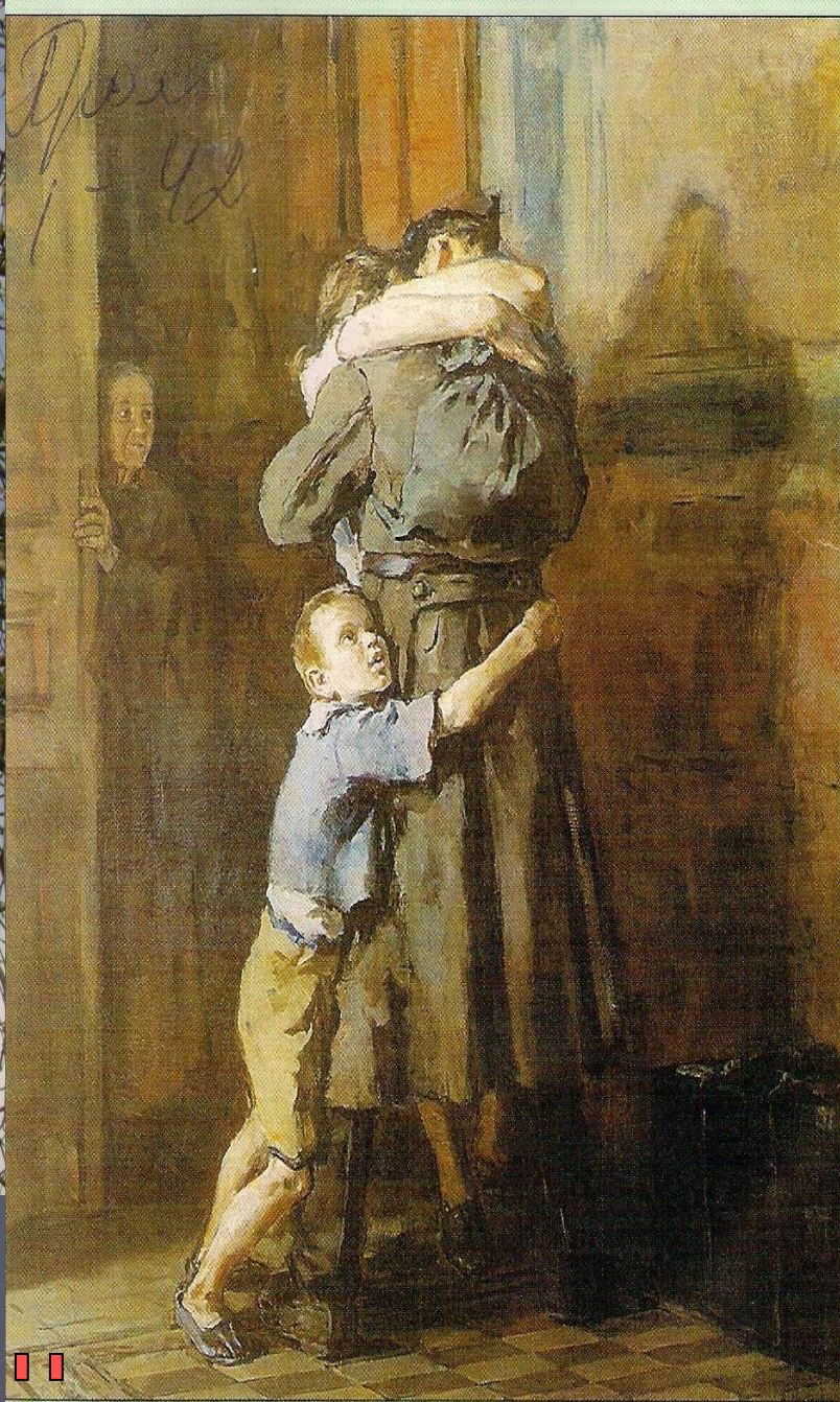
В.Н.Костецкий. Возвращение домой. 1945—1947