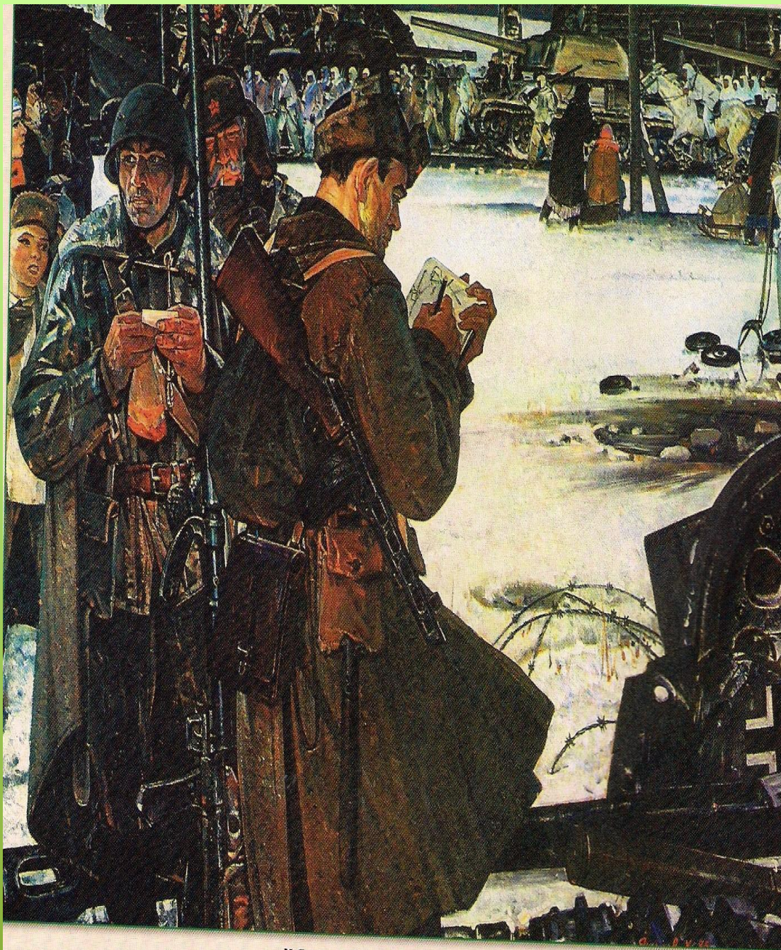
Х.Якупов. Фронтовые зарисовки. 1985

В годы Великой Отечественной войны А.Платонов служил корреспондентом "Красной звезды" непосредственно на фронте.