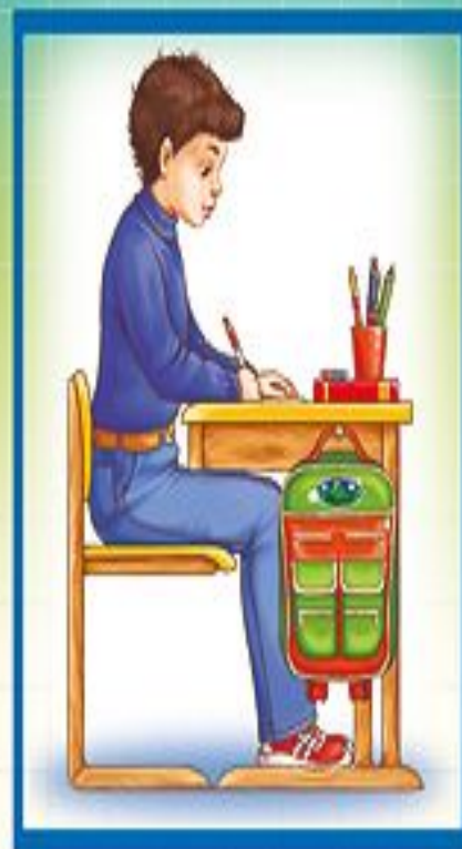
Посадка при письме