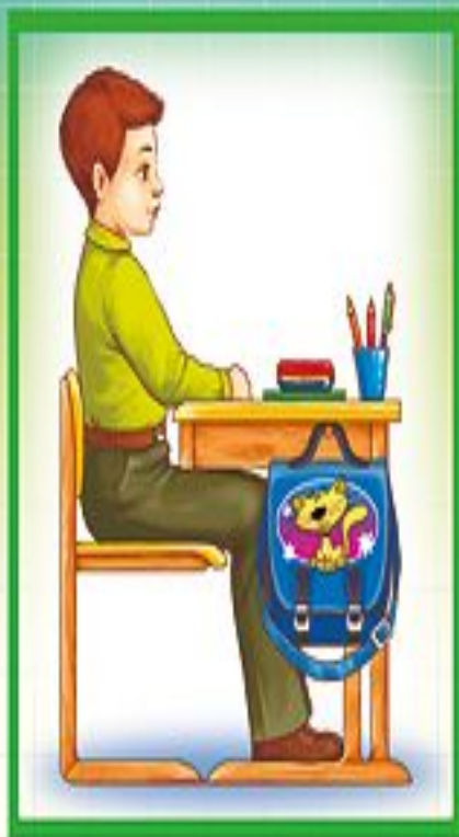
Посадка „Готов к работе“