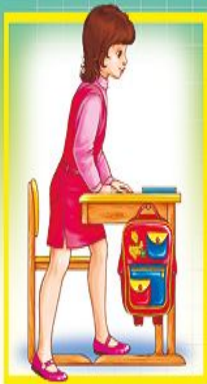
Посадка за парту