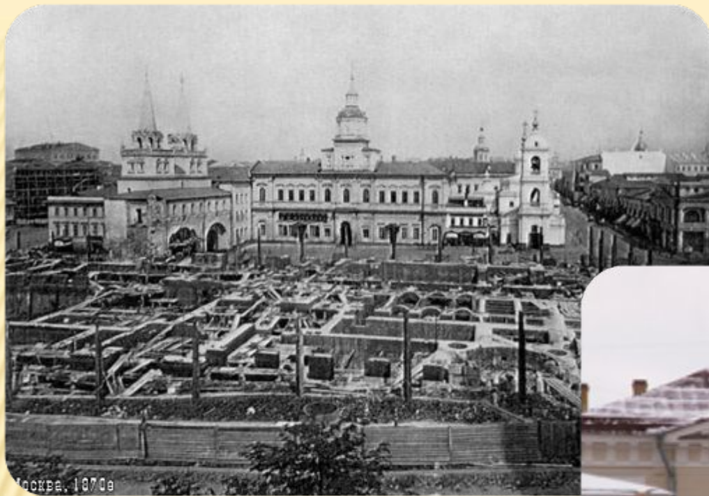
Москва, 1970е Москва, 10.09