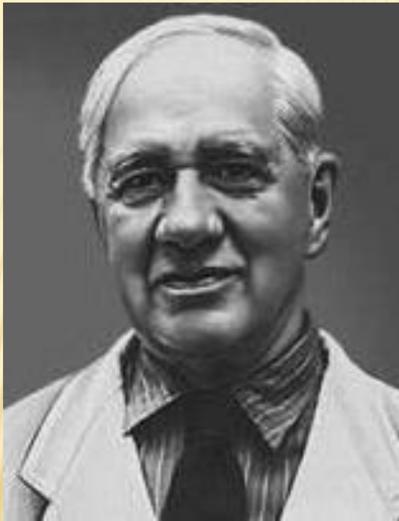
Корней Иванович Чуковский