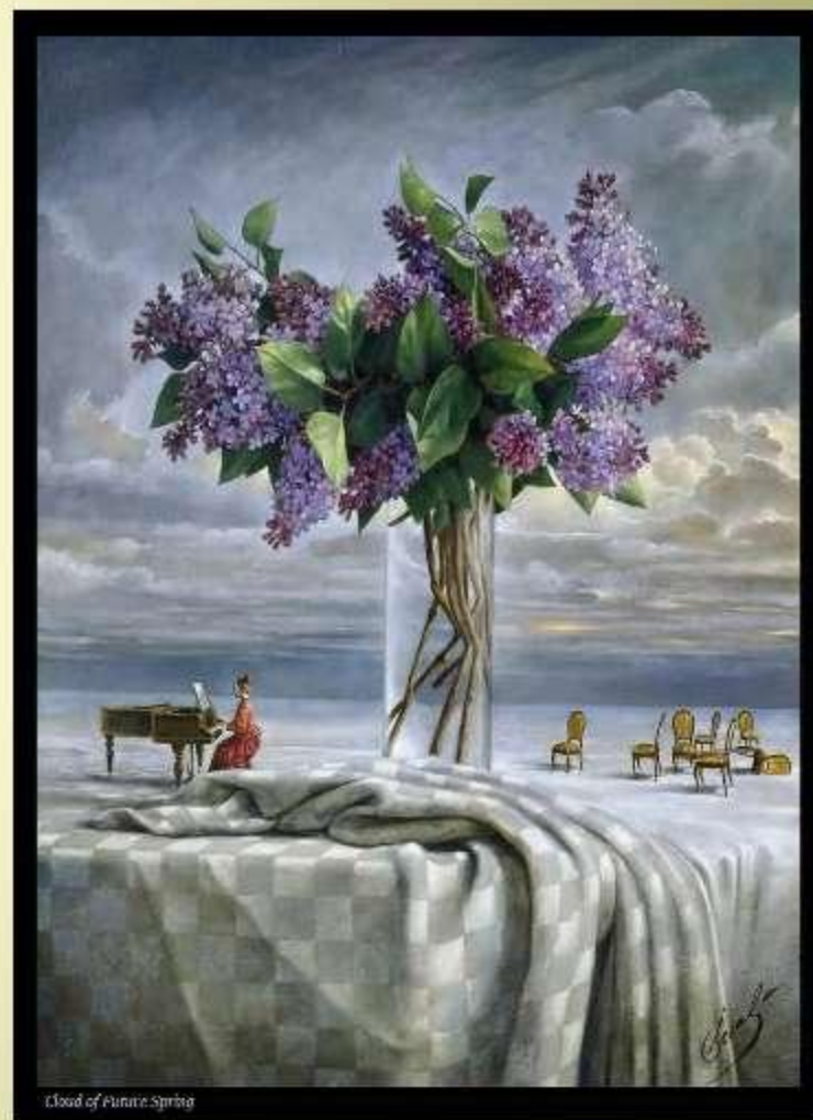
Cloud of Purple Spring