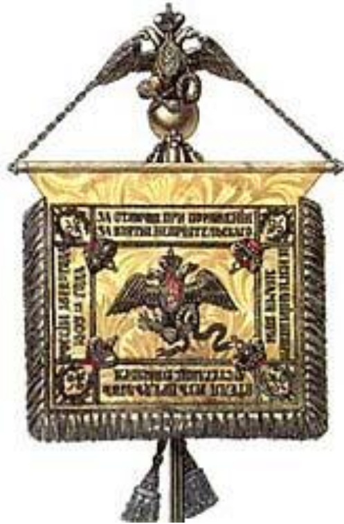
Георгиевский штандарт лейб-гвардии Конного полка

Ведь были ж схватки боевые, Да, говорят, еще какие! Недаром помнит вся Россия Про день Бородина!