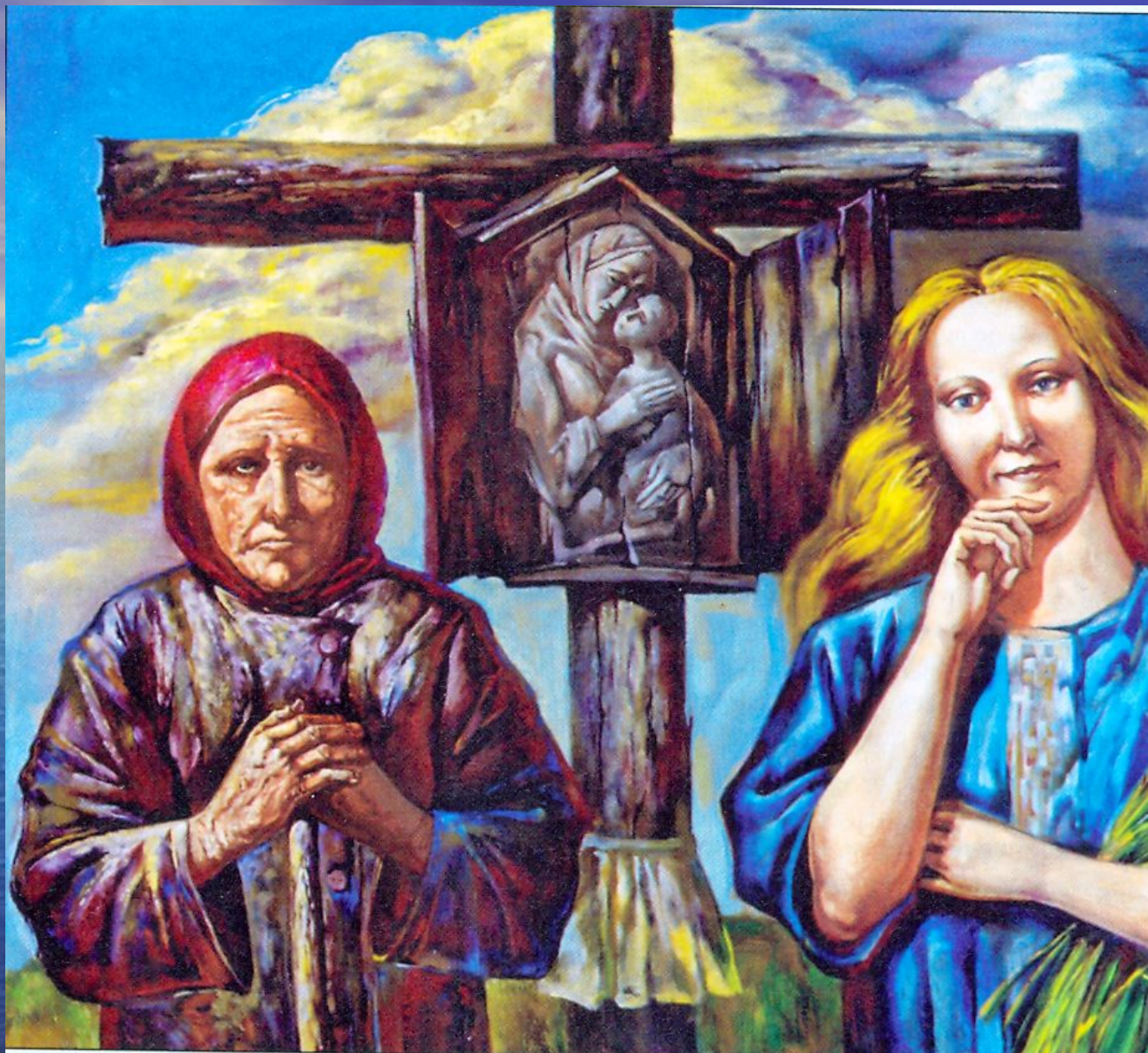
В. Ткачѐв. Извечное