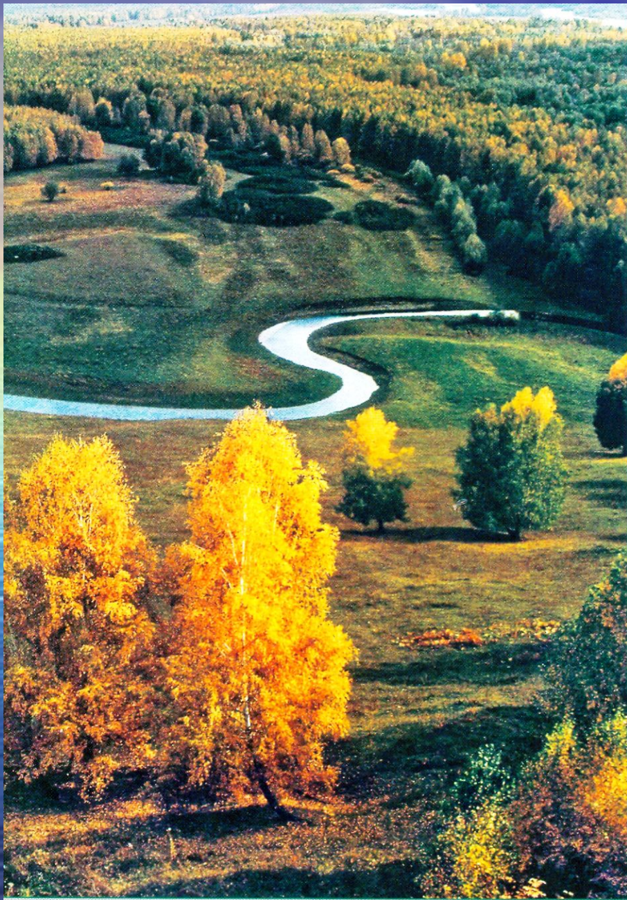
Пойма сибирской реки. 1990