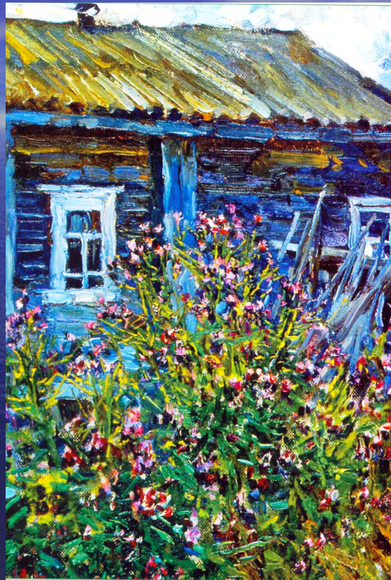
М.Абакумов. Старый дом. 2002