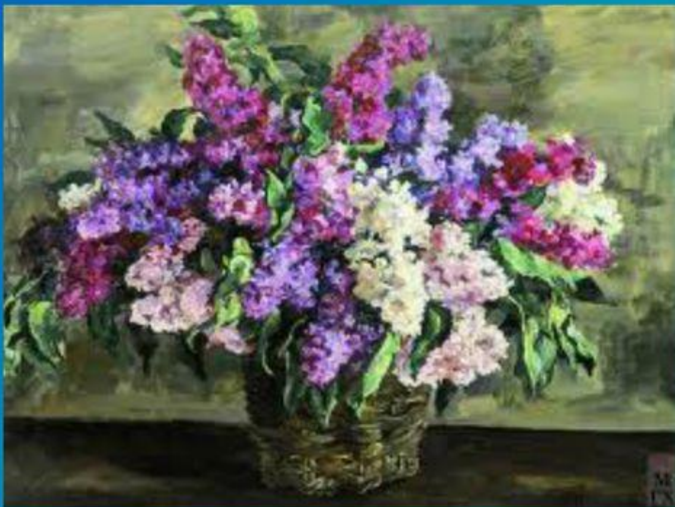
«Сирень в корзине»