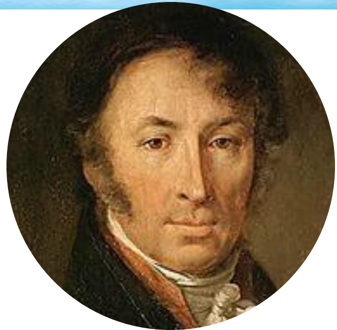
Музей. Дом Карамзина.