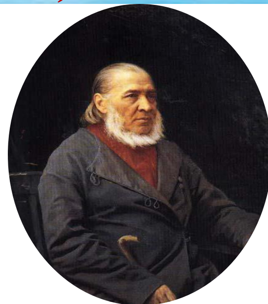
Музей- усадьба Аксакова