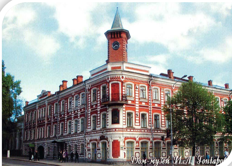
Дом-музей им.И.А. Гончарова