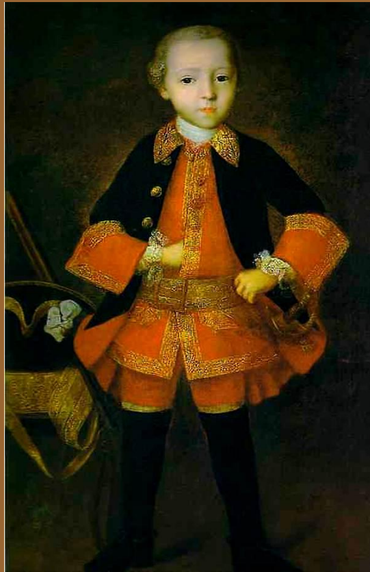
И.Я. Вишняков. Портрет Ф.Н. Голицына в детстве