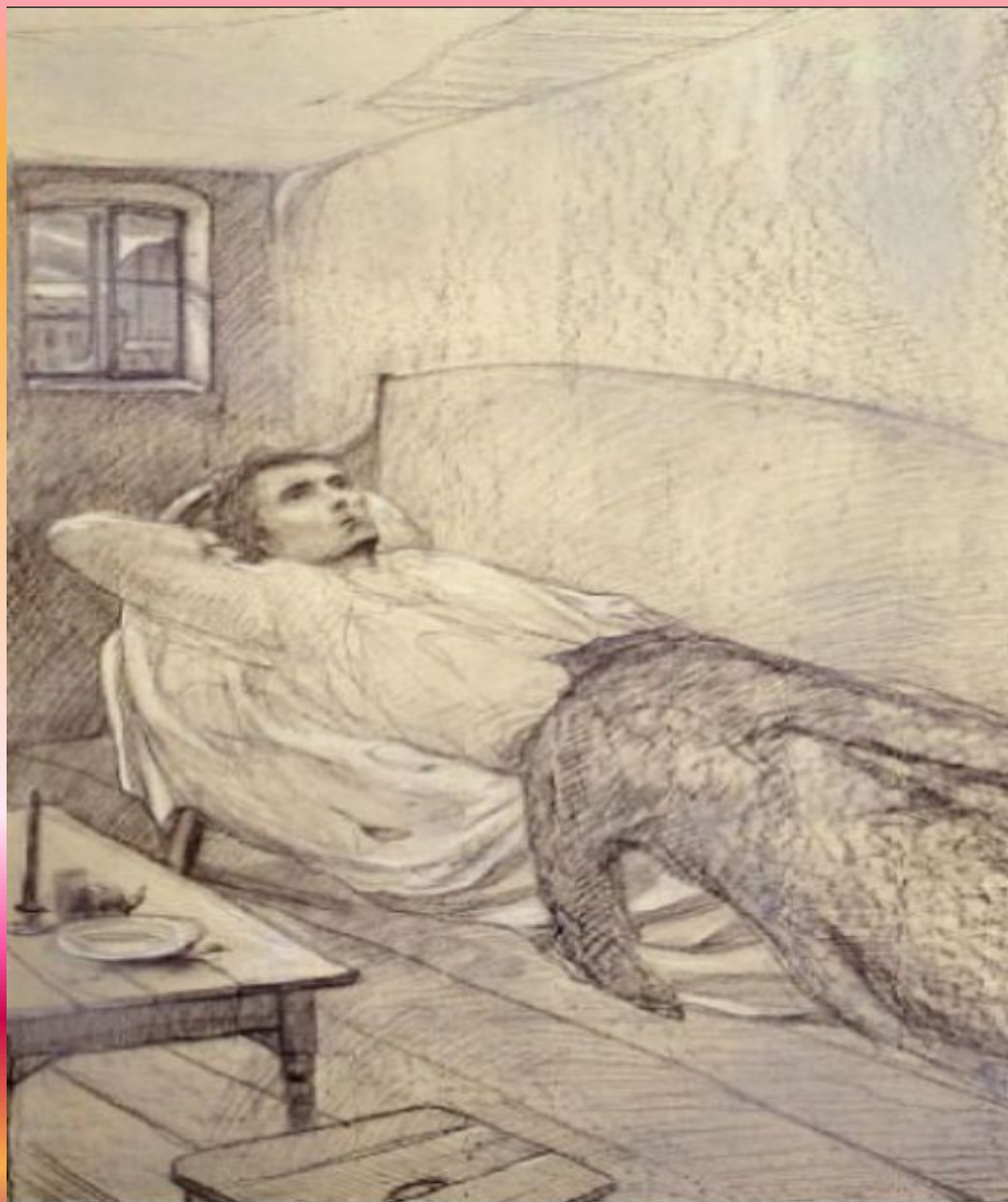
И. Глазунов. Раскольников в своей каморке