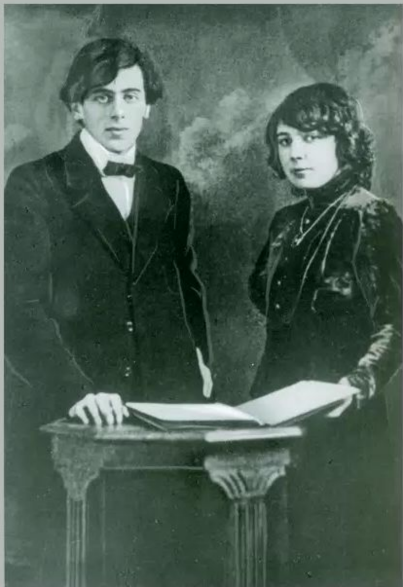
Марина Цветаева и Сергей Эфрон. 1912 год.