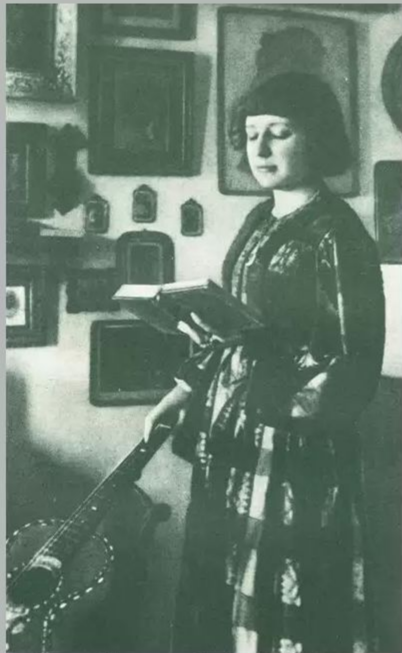
Марина Цветаева. Феодосия, 1914.