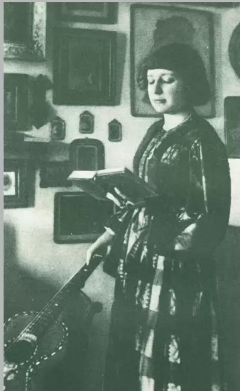
Марина Цветаева. Феодосия, 1914.