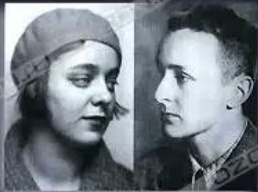
Ариадна и Мур