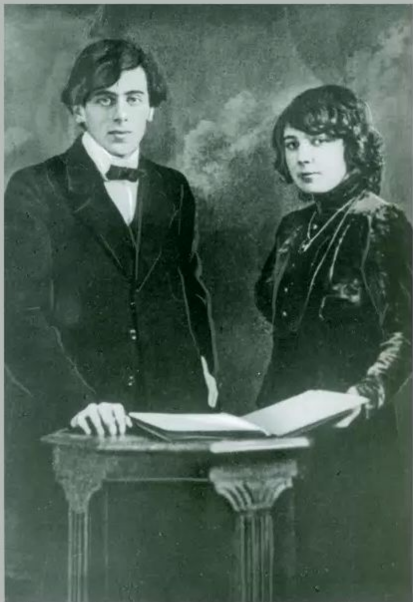
Марина Цветаева и Сергей Эфрон. 1912 год.