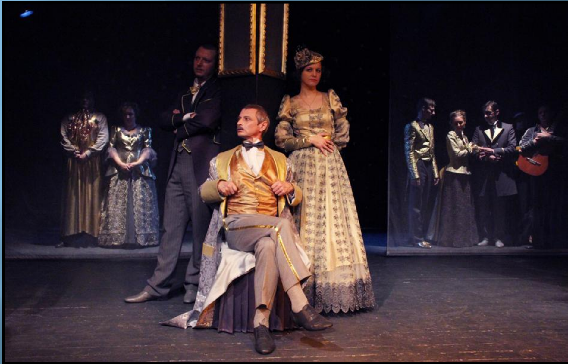
Пьеса «Доходное место»