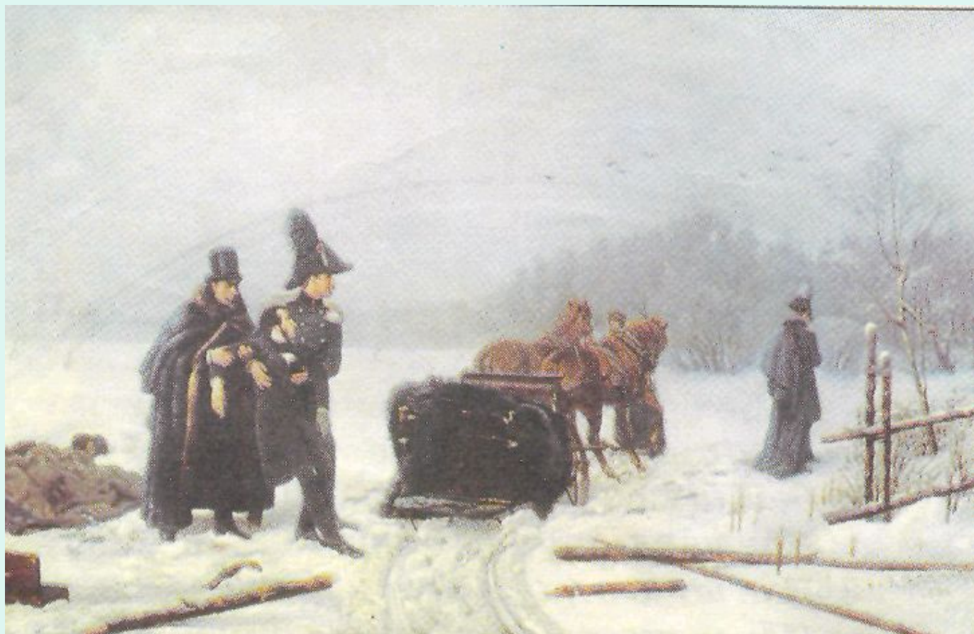
Алексей Аввакумович Наумов «Дуэль Пушкина с Дантесом» 1885 год