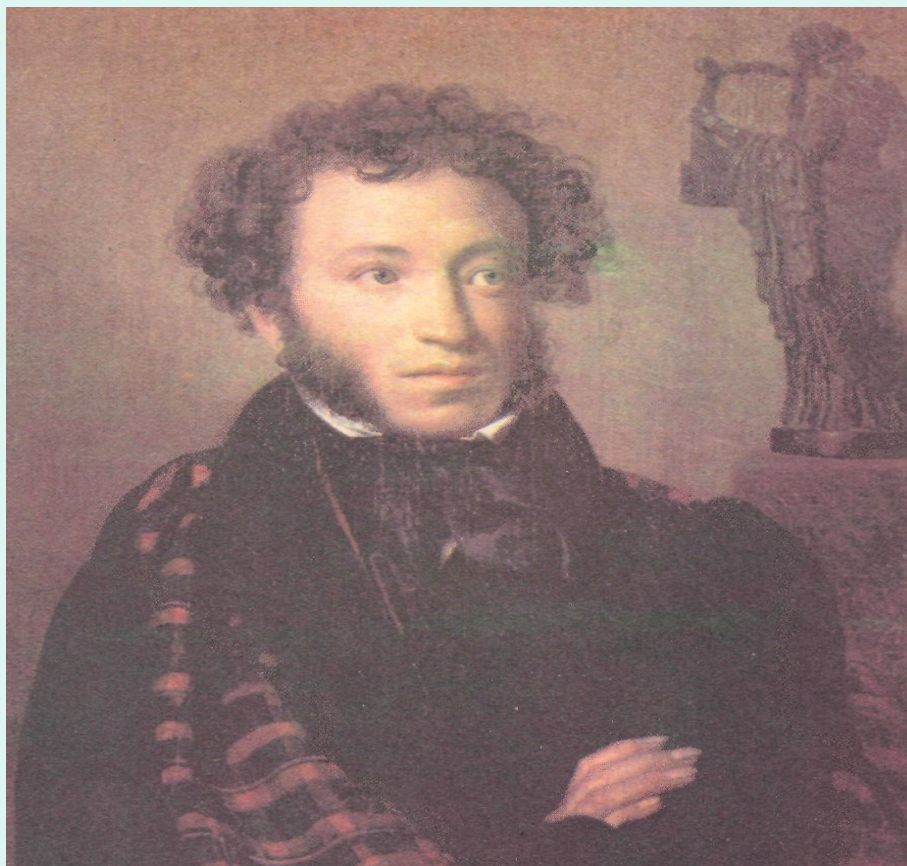
Орест Адамович Кипренский «Портрет А.С.Пушкина» 1827 год