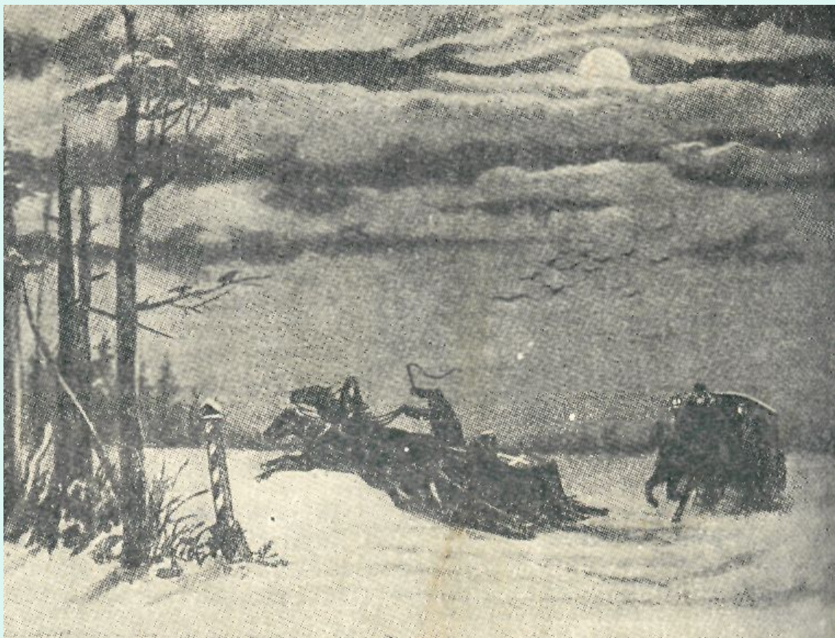
Пётр Фёдорович Борель «Возвращение Пушкина с дуэли» 1885 год