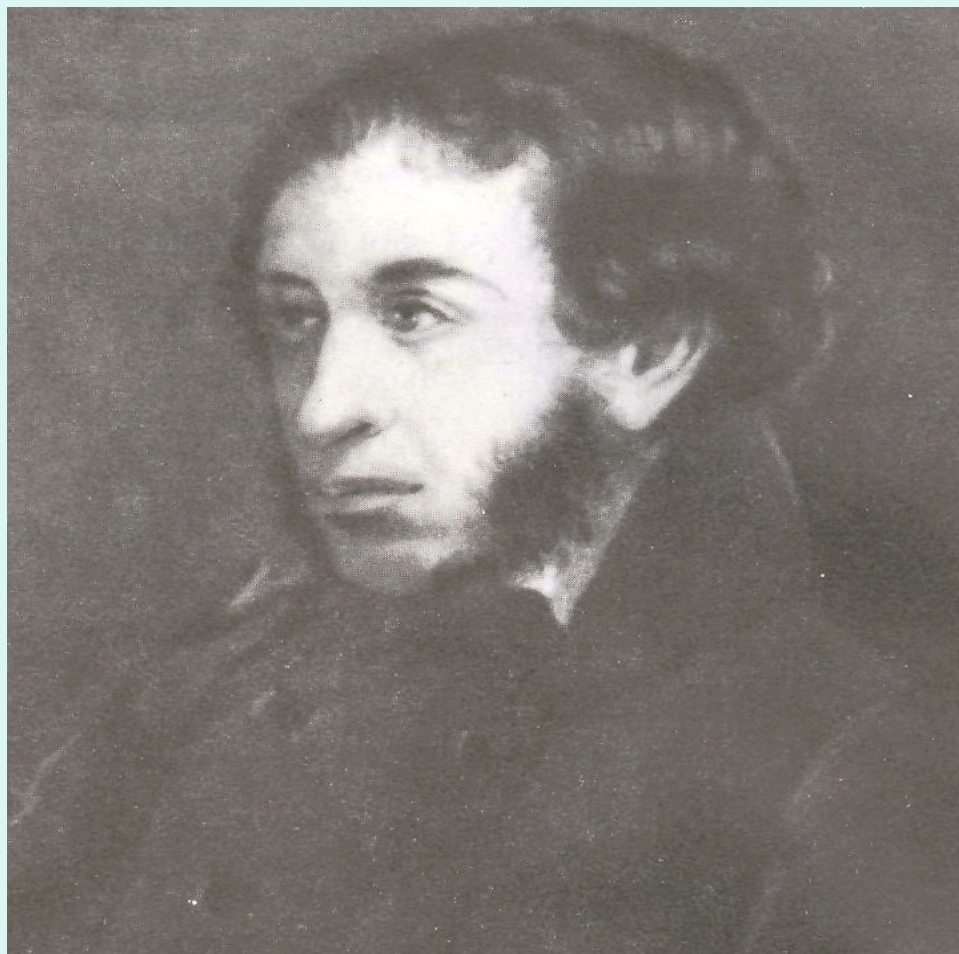
Иван Логинович Линёв «Портрет А.С.Пушкина» 1836 год