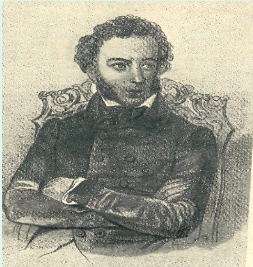
Пётр Фёдорович Соколов «Портрет А.С.Пушкина» 1830 год