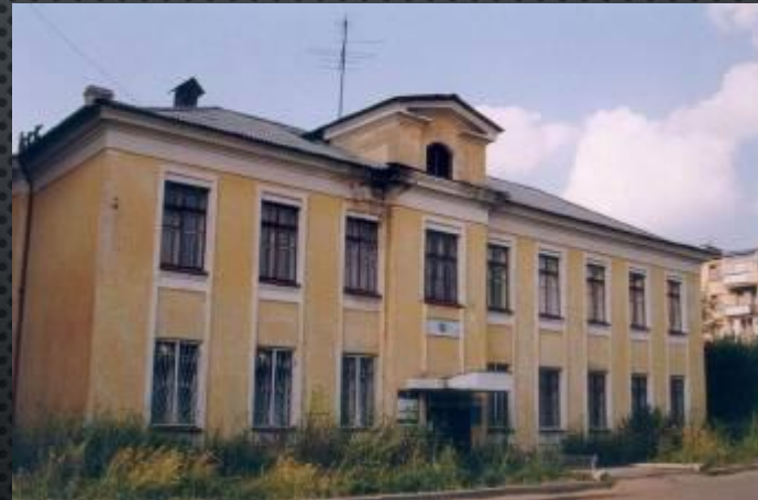
Здание гостиницы города NN

не способные ни к какому высокому душевному движению.