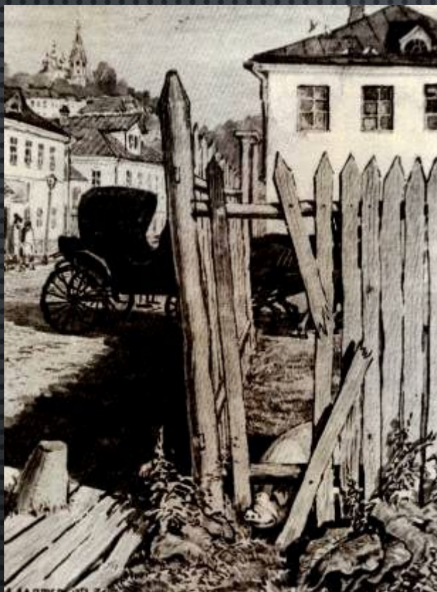
Въезд Чичикова в губернский город NN

Сюжет «Мертвых душ» состоит из трех внешне замкнутых, но внутренне очень связанных между собой звеньев: помещики, городское чиновничество и жизнеописание Чичикова.