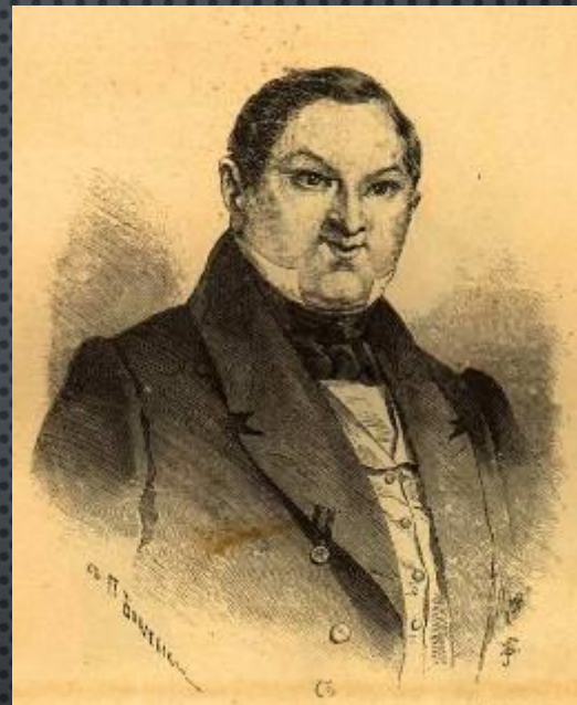
Портрет Чичикова работы П.Боклевского

« А добродетельный человек всё-таки не взят в герои... Нет, пора наконец припрячь и подлеца. Итак, припряжём подлеца!»