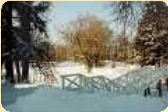
Зима в Болдино