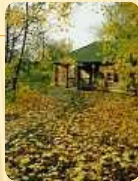
Банька А.С.Пушкина. Болдино.