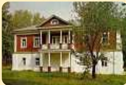
Трактир в Болдино