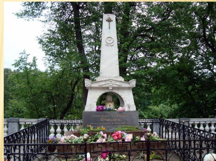
Музей - усадьба предков Пушкина