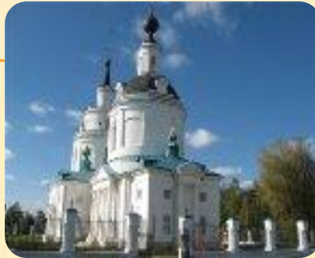
Церковь в Пушкинских местах. Болдино.