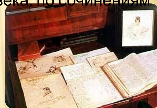
Пушкин или Корифей стихи о Пушкине