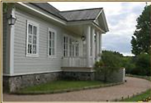
Родовое имение АС Пушкина Михайловское

МИХАЙЛОВСКОЕ... С ИМЕНИЕМ СВОЕЙ МАТЕРИ СЕЛЬЦОМ МИХАЙЛОВСКИМ В ПСКОВСКОЙ ГУБЕРНИИ АЛЕКСАНДР СЕРГЕЕВИЧ ПУШКИН БЫЛ СВЯЗАН НА ПРОТЯЖЕНИИ ВСЕЙ СВОЕЙ ЗРЕЛОЙ ЖИЗНИ - С 1817 ПО 1836 Г.Г.