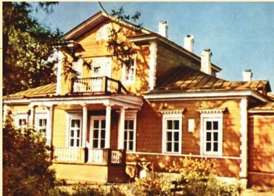
Дом Пушкина .Болдино.

Деду А. С. Пушкина принадлежали довольно крупные земельные владения вокруг Болдина. После его смерти земля была поделена между многочисленными наследниками, и в результате раздробления началось разорение старинного рода. Болдино досталось дяде Пушкина, Василию Львовичу, и отцу, Сергею Львовичу. После смерти Василия Львовича северо-западная часть села со старой барской усадьбой была продана. Отцу Пушкина принадлежала юго-восточная часть Болдина (с барским домом и другими постройками) — 140 крестьянских дворов, более 1000 душ, и село Кистенево.