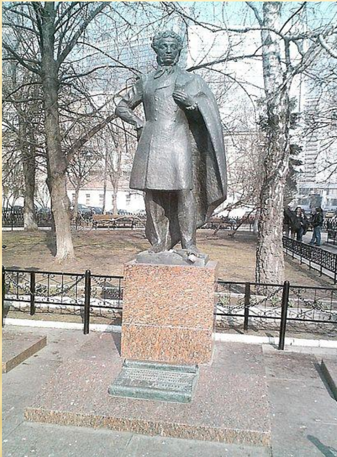
В Москве на Арбате