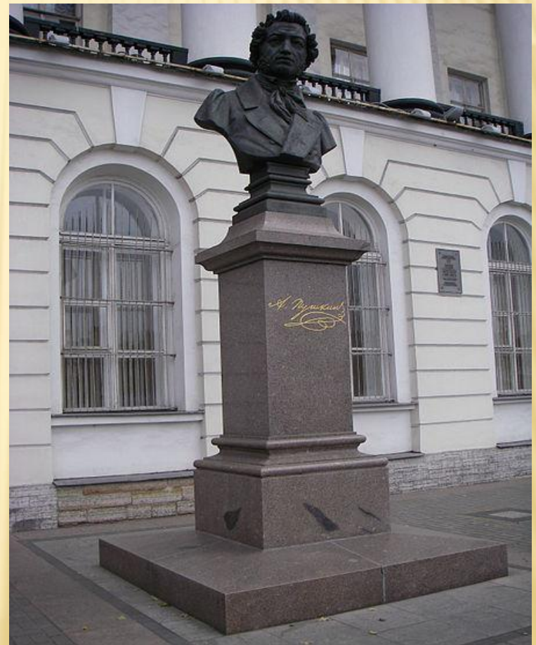
В Санкт-Петербурге у Пушкинского дома