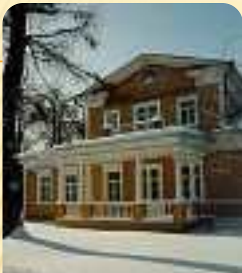
Государственный музей-заповедник А.С. Пушкина Болдино.