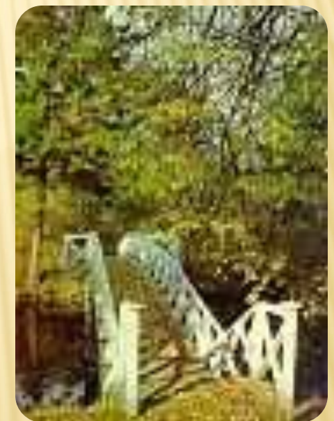
Пушкинское Болдино парк