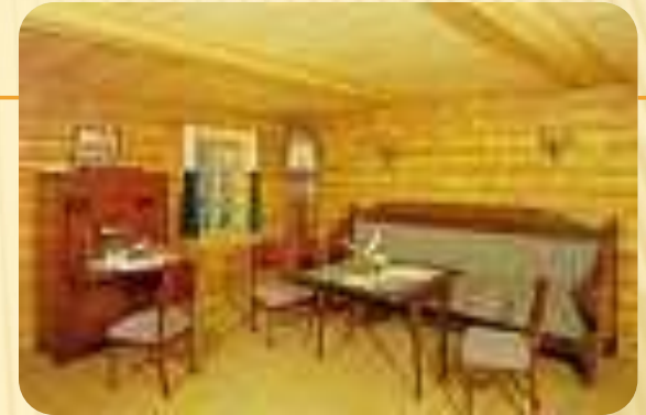
Музей-усадьба А.С. Пушкина Большое Болдино.