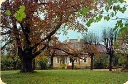
Усадьба . Михайловское