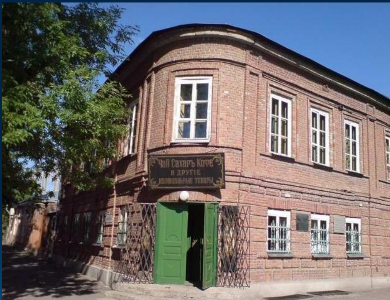
Лавка отца Чехова в Таганроге