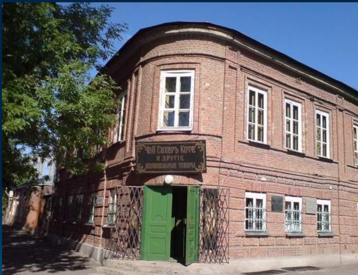
Лавка отца Чехова в Таганроге