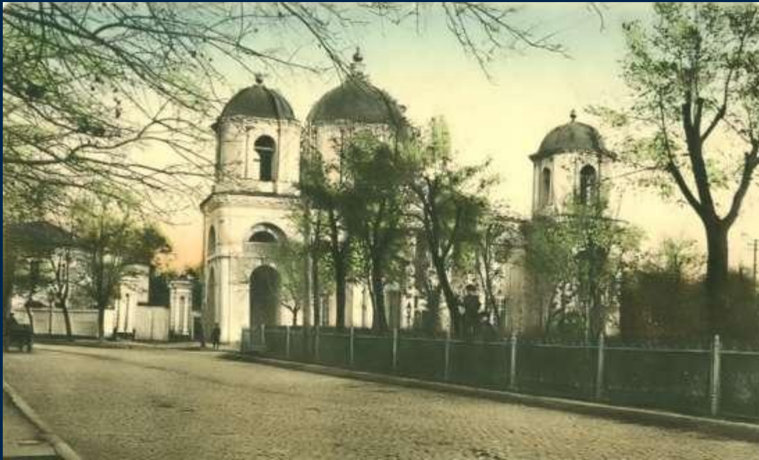
№ 2 г. Таганрогъ. Общій видъ. Taganrog. Vue totale.