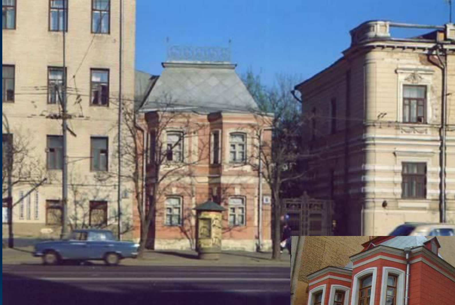
Дом в Москве