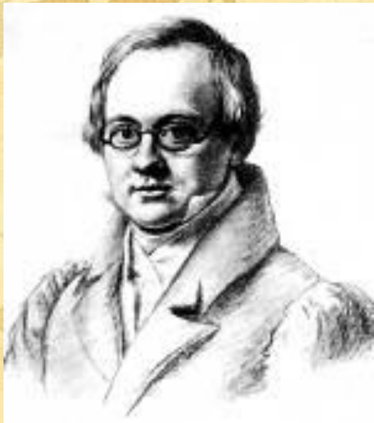
Антон Антонович Дельвиг