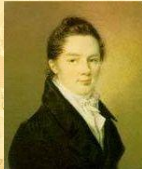
Иван Иванович Пуцин

Пушкин сохранил лицейскую дружбу и культ Лицея на всю жизнь.