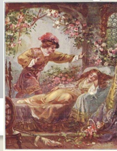
PRINCE FLORIMOND FINDS THE SLEEPING BEAUTY