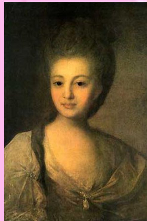
Портрет А.П. Струйской