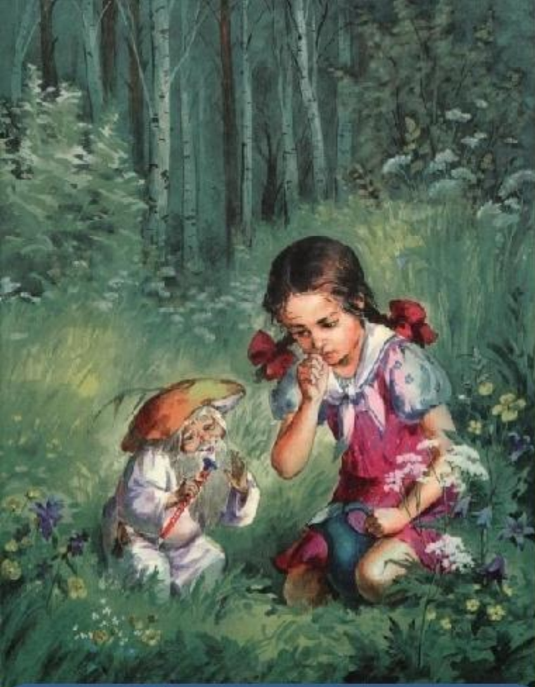
«Дудочка и кувшинчик»