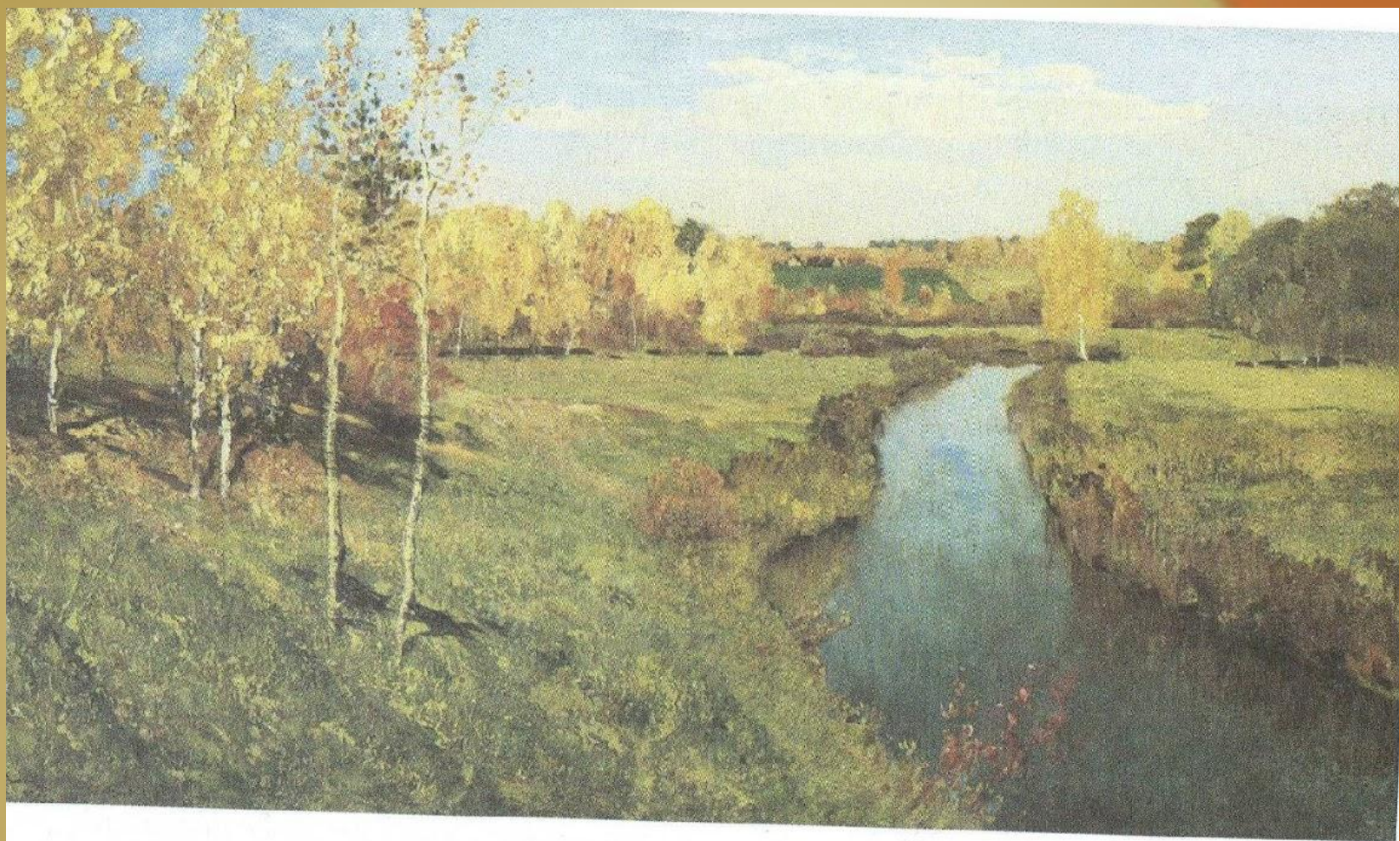
Репродукция картины И. И. Левитана "Золотая осень", с. 68

ОСЕНЬ. БЕРЁЗКИ. РЕЧКА. ЛЕС. ДЕНЬ. НЕБО. НАСТРОЕНИЕ.