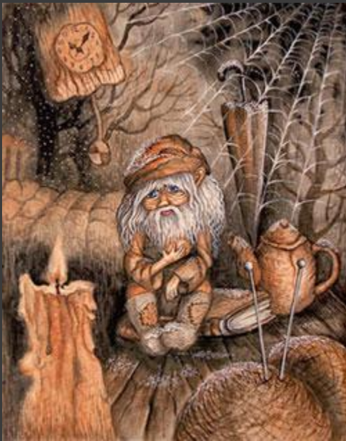
Хозяин (старый домовой). Худ. Владимир Черников.