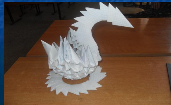
Замурий Игорь, 6 класс