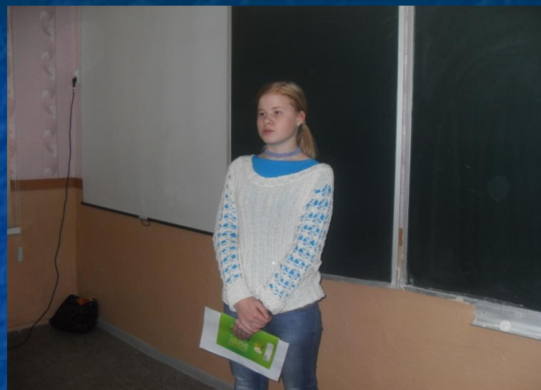
2 место – 10 класс Проект «Писатели Воронежской области 19 века»