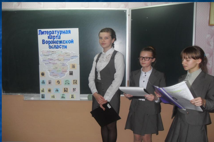
1 место – 7 класс. Проект «Литературная карта Воронежской области»