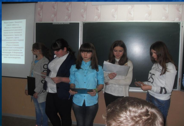
3 место - 9 класс Проект «Литературные места Воронежской области»