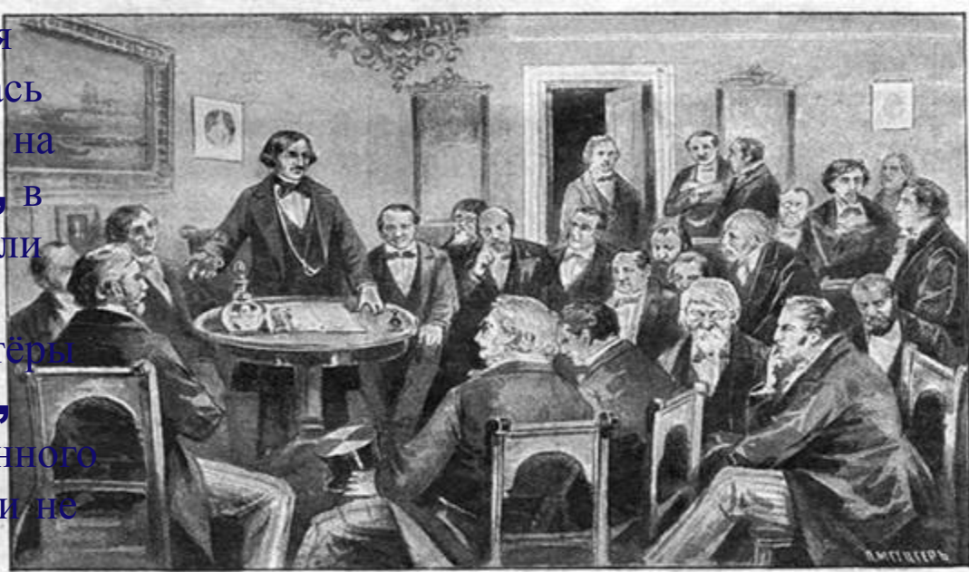
Гоголь читает „Ревизора“. (Со старинной литографии).

Комедия удивила актёров ещё во время первого чтения её автором. Она казалась трудной и малопонятной. Присутствуя на репетициях, Гоголь видел то смятение, в котором находились актёры: их смущали непривычные герои пьесы, отсутствие любовной интриги, язык комедии. Актёры не придавали значения советам Гоголя, игнорировали его указания. Общественного содержания пьесы актёры не оценили и не разгадали.