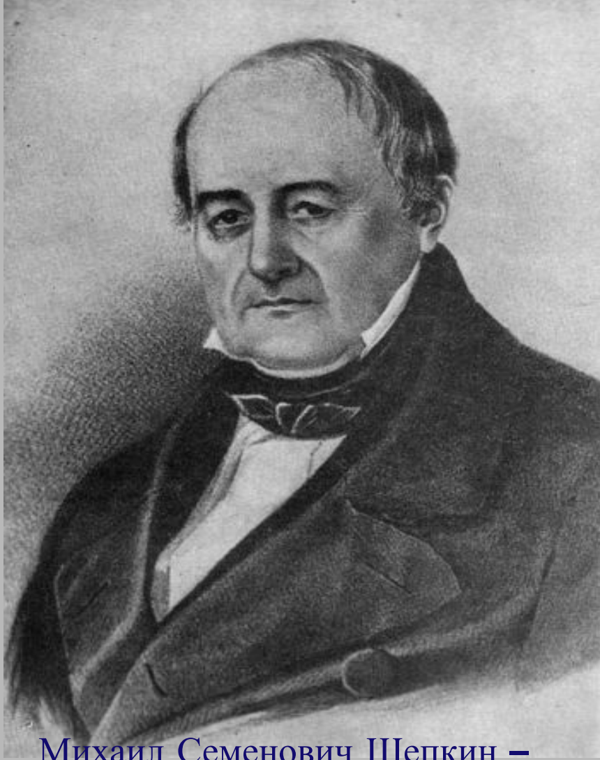
Михаил Семенович Щепкин – первый исполнитель роли городничего в Москве