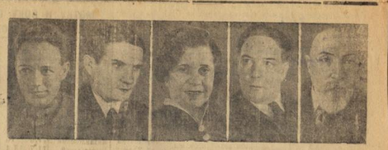
Выдающиеся деятели науки, литературы и искусства СССР, получившие Сталинские премии первой степени. Слева направо: академик Николай Александрович, действительный член Академии Наук СССР, академик Григорий Денисович, действительный член Академии Наук СССР, академик Владимир Владимирович, академик искусства СССР, академик Государственного Ученого Совета Академии Наук СССР, академик Петр Павлович, действительный член Академии Наук СССР, директор Украинского института экспериментальной офтальмологии.

Мело и настойчиво вести борьбу за высокий урожай Вспашка и прора- ботка полевой по- лейки — важнейшее условие высокого уро- жайности. Настойчиво и упорно вести борьбу за высокий урожай зерновых культур — важнейшее условие успеха колхозника. Вспашка и прора- ботка полевой по- лейки — важнейшее условие высокого уро- жайности. Настойчиво и упорно вести борьбу за высокий урожай зерновых культур — важнейшее условие успеха колхозника.