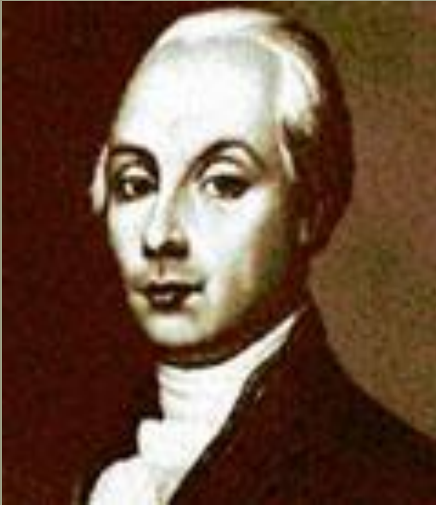
Александр Николаевич Радищев (1749-1802)

Я взглянул окрест меня – душа моя страданиями человечества уязвлена стала.