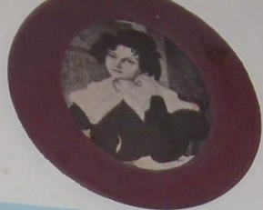
ВОЛКОНСКАЯ МАРИЯ НИКОЛАЕВНА (1805 – 1863) Младшая дочь И.И. Раевского. В январе 1825 г. стала женой декабриста С.Г. Волконского, за которым последовала в Сибирь и провела там вместе с мужем 30 лет. В Урине Волконские занималась воспитанием и обучением своих детей, готовила по рецептам Вольфа лекарства. Летом с семьей открыла в Усть-Куде, где у них была дача на Камытнике. С мужем М.И. Раевской – Волконской, по мнению некоторых исследователей, связаны цикл лирических стихотворений, написанных А.С. Пушкиным на юге, а также «На холмах Грузии» и «Яко пел, красавица, при мне».