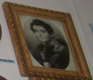
МУРАВЬЕВА НИКИТА НИКОЛАЕВНА (1798 – 1864) Декабристка, женой декабриста Николая Николаевича Муравьева-Амурского. В августе 1825 г. последовала за мужем в Сибирь. На поселении в Иркутске занималась воспитанием детей. В 1830-е гг. вместе с мужем переехала в Тобольск. В 1845 г. вместе с мужем переехала в Иркутск. Умерла в Иркутске в 1864 г.