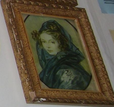
АЛЕКСАНДРА ГРИГОРЬЕВНА МУРАВЬЕВА