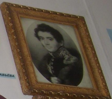
МУРАВЬЕВА НИКИТА НИКОЛАЕВНА (1798 – 1864) Декабристка, жена декабриста Николая Николаевича Муравьева-Амурского. В 1825 году вместе с мужем переехала в Сибирь. Находясь в ссылке, занималась воспитанием детей, обучением их грамоте и русскому языку. Находясь в ссылке, писала стихи, которые были опубликованы в журнале «Современник».