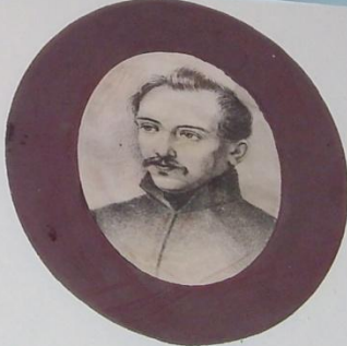
ВОЛКОНСКИЙ СЕРГЕЙ ГРИГОРЬЕВИЧ, КНЯЗЬ (1788 – 1868) Декабрист. Участник военных походов 1805 – 1807 годов, Отечественной войны 1812 года и заграничных походов 1813 – 1814 годов. Награжден золотой шпалгой «За храбрость», многими знаками отличия и орденами. Генерал – майор. После восстания 14 декабря 1825 года как один из руководителей Южного общества был сослан на каторгу в Сибирь. 26 марта 1837 года Волконские прибыли в Иркутск и в тот же день были отправлены на поселение в с. Урик. Вскоре Волконские построили себе дом на окраине села, по соседству с Муравьевыми. В Урине для Волконских открылась широкая возможность заниматься земледелием. Занимался он сельским хозяйством с увлечением. Волконские, Трубецкие, Муравьевы отличались большим гостеприимством. В 1845 году Волконским разрешили переехать в Иркутск. У Преображенской церкви они купили одноэтажный дом, а свой перевезли и надстроили