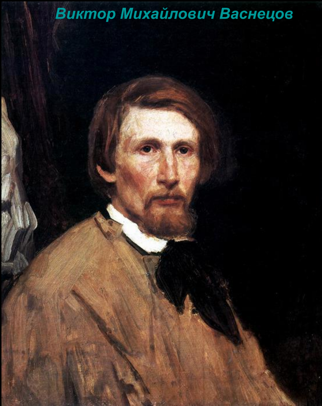
Виктор Михайлович Васнецов